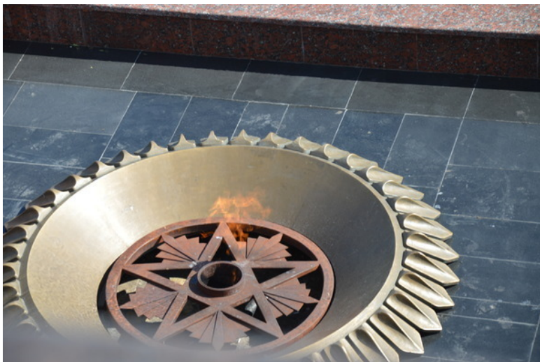
Вечный огонь.. г. Ульяновск.