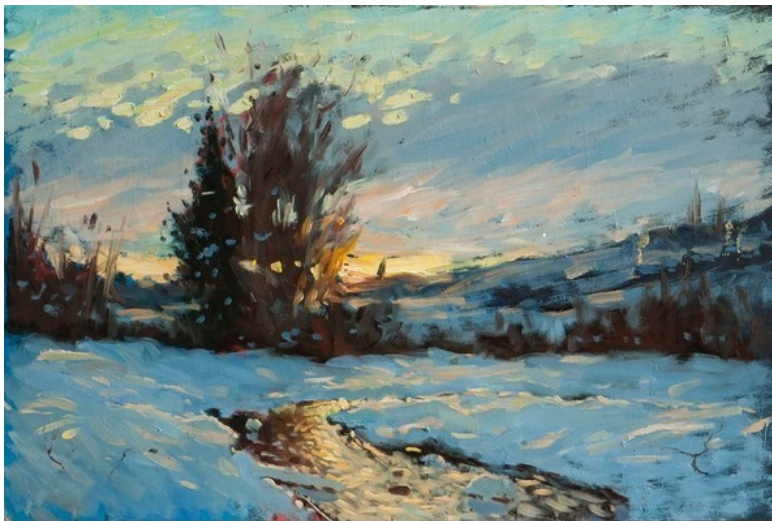
Картина Е. Смирнова «Ручей»

Словно листья облетели, И новые, в душе уж подросли, Зимы, печальные недели, Пролетели, А жизни смысл, Начало вновь весны!