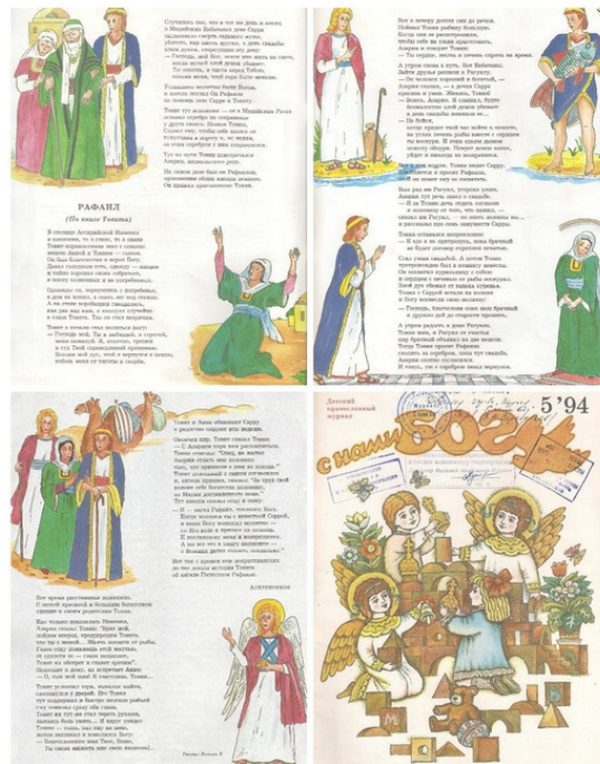
Страницы журнала "С нами Бог", с текстом "Архангела Рафаэла" и обложка этого номера журнала.