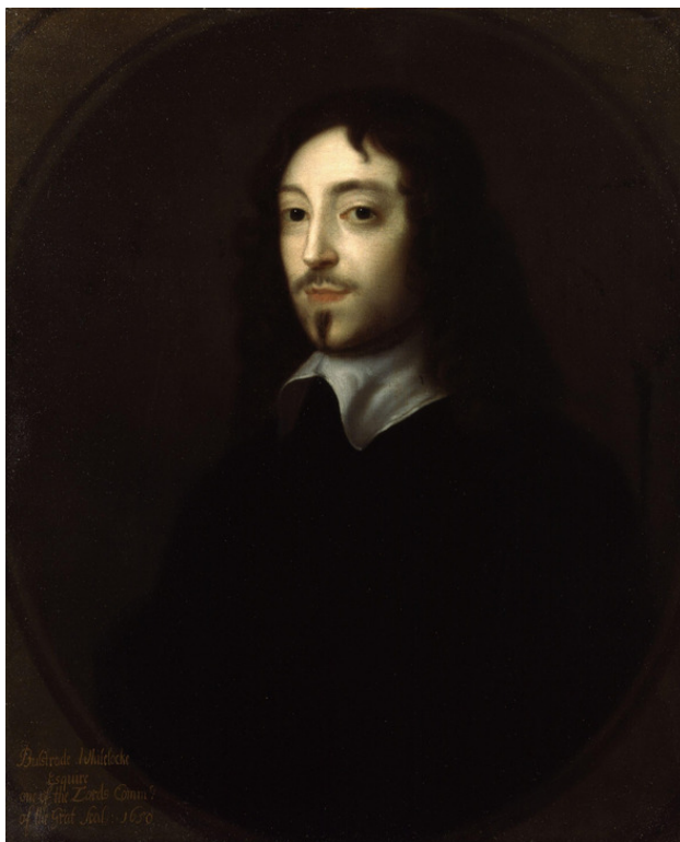
Английский посол в Швеции Булстроуд Уайтлок. Неизвестный художник.

Корабли вышли в открытое море 6 (16) ноября и после тяжелого перехода, вызванного осенними штормами, прибыли в Гётеборг 15 (25) ноября. За день до этого Мингсу удалось захватить голландское судно. Шкипер последнего пытался уйти от погони, но ядро, выпущенное с борта «Элизабет», «сбило один из парусов голландца; тогда он (английский фрегат. – В.Г.) взял его, хотя он (голландский корабль. – В.Г.) обладал превосходными мореходными качествами и имел добрые пушки».