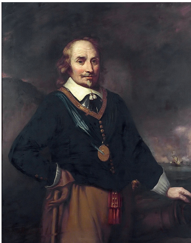
Адмирал Маартен Тромп. Художник Ян Лифенс.

К концу дня 12 голландских кораблей были либо потоплены, либо взяты в качестве призов; большая группа голландских кораблей вышла из боя и стала уходить на север. Все попытки Витте де Вита остановить их оказались безуспешными. Хотя флот Монка тоже понес ощутимые потери и вынужден был уйти в родные порты на ремонт, англичане считали, что победа в сражении при Схефенингене досталась именно им. С другой стороны, голландцы добились своей цели – блокада их побережья была снята.