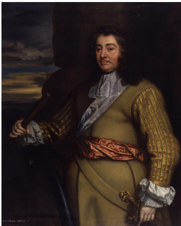
Джордж Монк, 1-й герцог Альбемарль. Студия Питера Лели.

Англичане располагали примерно 120 кораблями. Чтобы деблокировать 27 кораблей вице-адмирала Витте де Вита, стоявших в гавани Тексела, адмирал Маартен Тромп вывел в море флот в составе 100 кораблей.