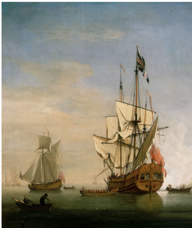
Английский корабль 6-го ранга. Художник Виллем ван де Фелде-младший.

судном после того, как их привели, и, обеспечив два из них людьми, отправился вместе с нами, и так привели остальных в Даунс. Мы получили два опасных попадания в грот- и фок-мачту, что заставило нас укрепить их с помощью шкало 6 , и мы потеряли нашего штурмана». 6 (16) октября парламент распорядился, чтобы Государственный Совет наградил капитана фрегата «Элизабет» за отличное исполнение им своих обязанностей и рассмотрел вопрос о выделении материальной помощи «жене и детям его штурмана, погибшего на этой службе».