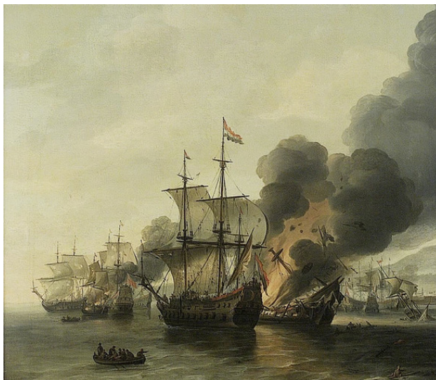
Сражение у Ливорно. Художник Виллем ван Дист.