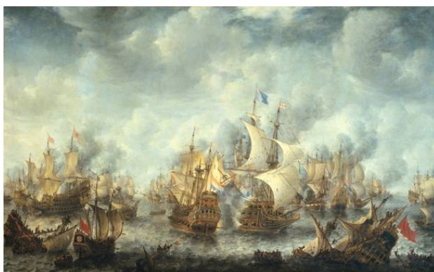
Сражение при Схефенингене. Художник Ян Абрахамс Беерстраатен.

К концу дня 12 голландских кораблей были либо потоплены, либо взяты в качестве призов; большая группа голландских кораблей вышла из боя и стала уходить на север. Все попытки Витте де Вита остановить их оказались безуспешными. Хотя флот Монка тоже понес ощутимые потери и вынужден был уйти в родные порты на ремонт, англичане считали, что победа в сражении при Схефенингене досталась именно им. С другой стороны, голландцы добились своей цели – блокада их побережья была снята.