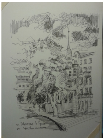
Минская улица в Праге

Разве что ночные грозы громогласно заявляют – лето в городе! Да туристы.