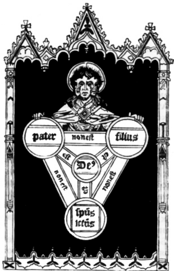
Из книги Хоуна „Описанные древние мистерии”