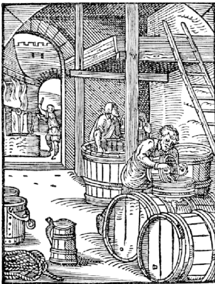
Рис. 0.1. Интерьер немецкой пивоварни XVI века из книги Йоста Аманна Ständebuch (1568 год)

США (77 л), Россия (74 л), Литва (72 л), Великобритания (68 л), Украина (61 л). Но эти показатели усредненные – в действительности нужно учитывать региональные отличия. Например, очевидно, что жители Баварии опережают чехов, а жители севера страны значительно от них отстают.