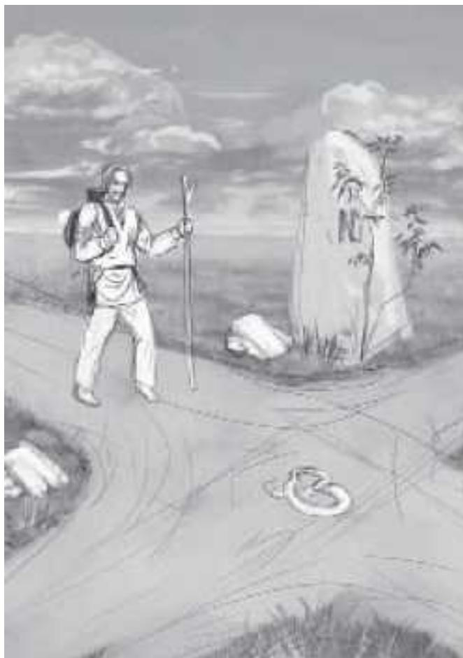
Рабочий рисунок карты 9 Отшельник.

Ведь, используя Таро как дополнительный источник информации, мы ожидаем именно новой информации, нового, а не старого взгляда и видения проблемы. Именно к этому и необходимо быть готовым. Конечно, есть те, кто пытается использовать, пусть и неосознанно, Таро как подтверждение своих мыслей, тем самым уходя все больше и больше в иллюзию, отказываясь от возможности получить реальную поддержку.