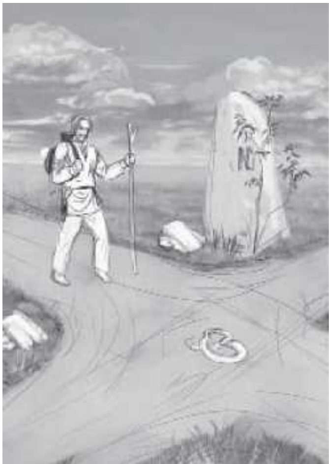
Рабочий рисунок карты 9 Отшельник.

Ведь, используя Таро как дополнительный источник ин-