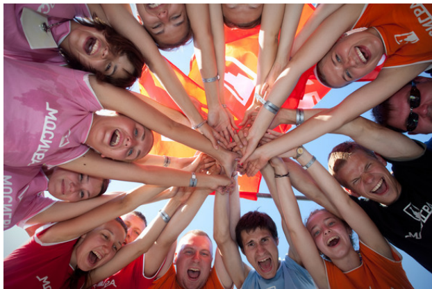
Фотография из личного архива героя