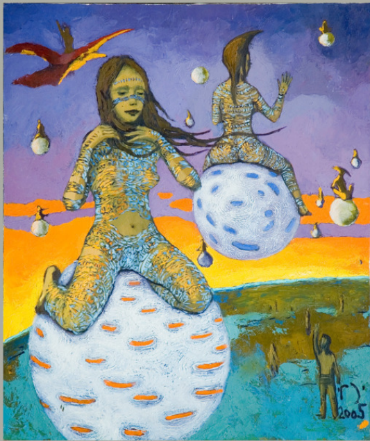
Вечерний привет х/м 95x80