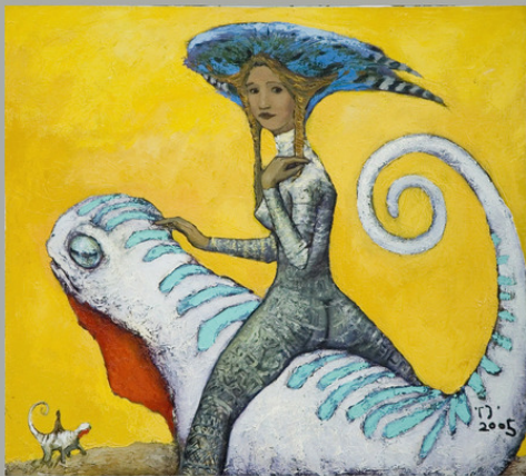
Встреча всадниц х/м 90x100

На полу лежал сверток. Он лежит у меня до сих пор. Думаю подарить его кому-нибудь на Новый год. Может быть, вам?