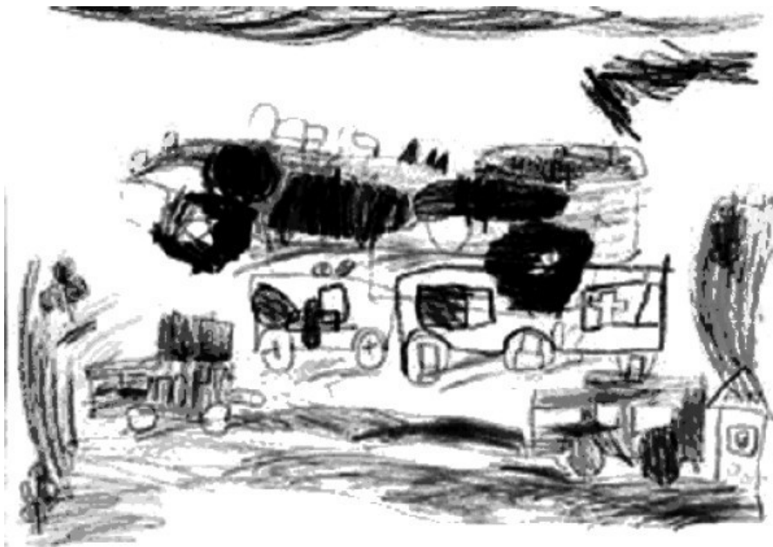
Рис. 5. Война

К пяти годам ребенок уже умеет писать свое имя печатными буквами, в его рисунках появляется очевидный смысл, они носят сюжетный характер. С особым удовольствием пятилетние дети рисуют разных животных, птиц, всевозможные предметы быта, деревья, цветы (рис. 4).