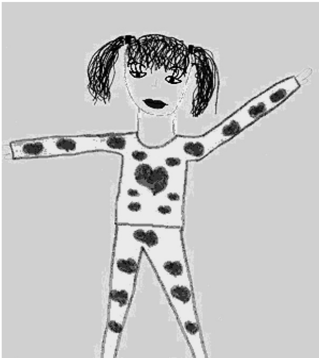
Рис. 6. Девочка в спортивном костюме

В дальнейшем, в возрасте десяти лет, у детей возрастает стремление реалистично отображать в рисунке все увиденное [2].