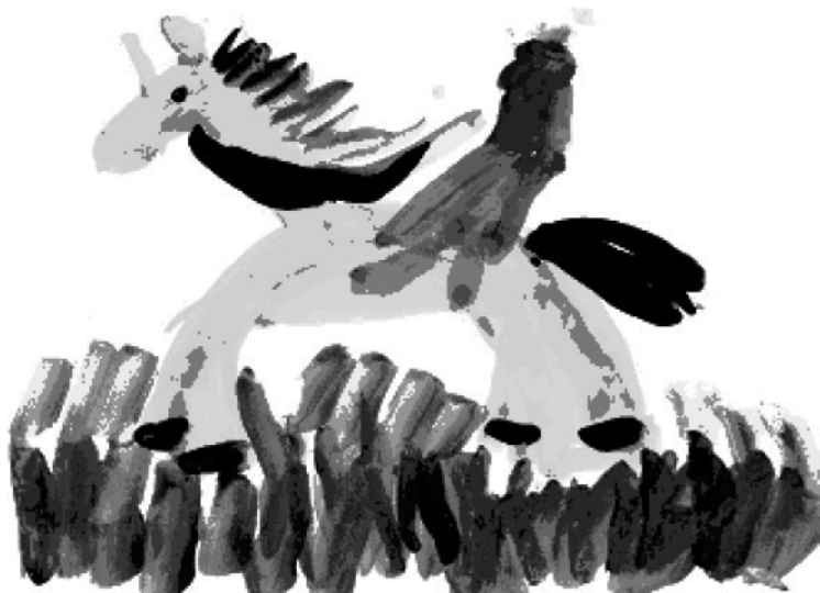
Рис. 4. Лошадка