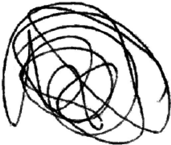
Рис. 1. «Каракули»

Прослеживая развитие ребенка с самого раннего детства, можно увидеть, что навыки художественного творчества, параллельно с дописьменными, развиваются поэтапно в определенной последовательности. Так, к году-полутора ребен-