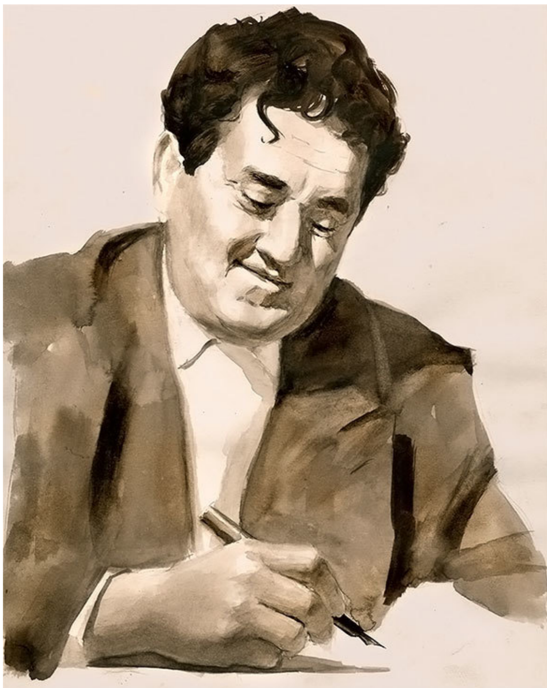
Виктор Юзефович ДРАГУНСКИЙ 1913–1972