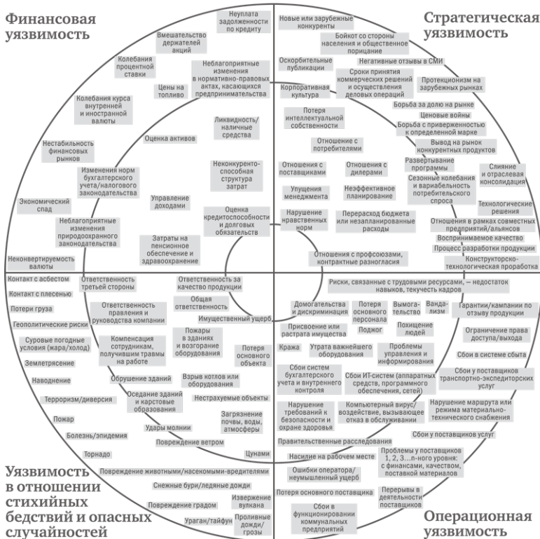
Рис. 2.3. Концентрическая карта уязвимости

Менеджеры цепочки поставок GM уделяют основное внимание двум нижним секторам: уязвимости в отношении стихийных бедствий и опасных случайностей и операционной