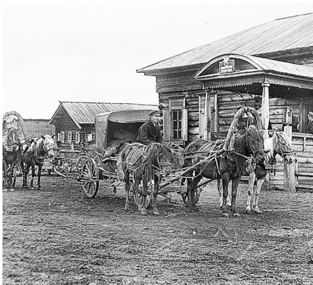
Сибирский извоз. Фото начала XX в.

Так и не узнали бы многие люди о селе в сибирской глубинке, если бы не Григорий Ефимович. Его имя позволило даже открыть здесь музей. Жаль только, что снесли дом «старца», хранивший память о своём неординарном владельце.