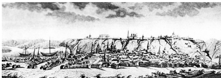
Тобольск. С гравюры XVIII в.

С другой стороны, не занятая никем сибирская земля ждала своего хозяина – работающего крестьянина из центральной России, где наделов на всех катастрофически не хватало. Судьба переселенцев складывалась по-разному. Всё зависело от места, где располагался земельный участок, богатое было село или нет. В иных местах и земли хватало на всех, но не рос на ней хлеб – то камней много, то солончаков. Полей в Сибири в те годы было мало, и многие из них были отвоёваны у густого векового леса. Это в наши дни лес не помеха, а тогда он становился непреодолимой преградой для развития земледелия в суровом северном краю. История сибирских поселений знает случаи переноса сёл на новое место, за десятки вёрст от старого. Например, в районе Верхотурья хорошие пахотные земли располагались в 100 верстах от города, деревни были малолюдны. В основном деревни состояли из одного (!) двора, а самой большой была деревня на реке Невье с десятью дворами. Необходимо отметить, что указанное положение вещей сохранялось до начала XIX столетия.