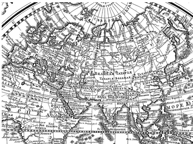
Сибирь на карте XVIII в.

ка, какой далёкой казалась (да и сейчас кажется) эта земля. Расстояние от Тобольска до столицы Российской империи составляло 2834 верст 15 , до Москвы – 2318 верст 16 .