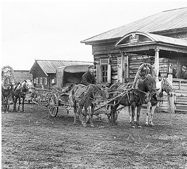
Сибирский извоз. Фото начала XX в.

Особых достопримечательностей в Покровском никогда не было. Долгое время возвышался над селом православный храм, но его разобрали в 1953 году, а на освободившемся от церковного здания участке построили типовой Дом культуры.