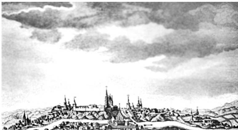
Верхотурье. С гравюры XVIII в.

Общая численность жителей города достигала 850 человек, но нужно учитывать, что в список не включены женщины, дети, священники с семьями и монашество 18 .