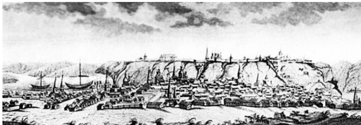
Тобольск. С гравюры XVIII в.

Бескрайние сибирские просторы русские заселяли охотно, и процесс этот нарастал с каждым годом. В конце XIX столетия на территории губернии проживало почти 1,5 миллиона жителей, а города Тюмень, Тобольск и Курган уже были важными экономическими центрами не только региона, но и всей империи. Напомню, что при Петре I число русских сибиряков едва превышало 250 тысяч человек, так что прирост населения был значительным.