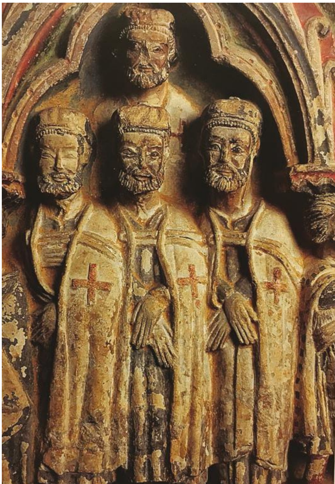
Рыцари-монахи ордена Храма Фрагмент саркофага донны Леоноры Руиз де Кастро в церкви Санта-Мария. XIII в. Виль- алькасар-де-Сирга, Испания. Фото репродукции