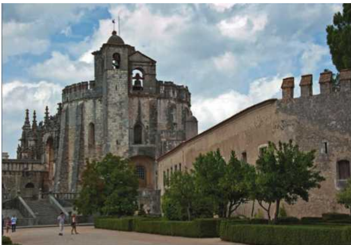
Конвенту-де-Кришту (монастырь ордена Христа)

Так куда направить энергию? В Европу, в X, XI, XII века.