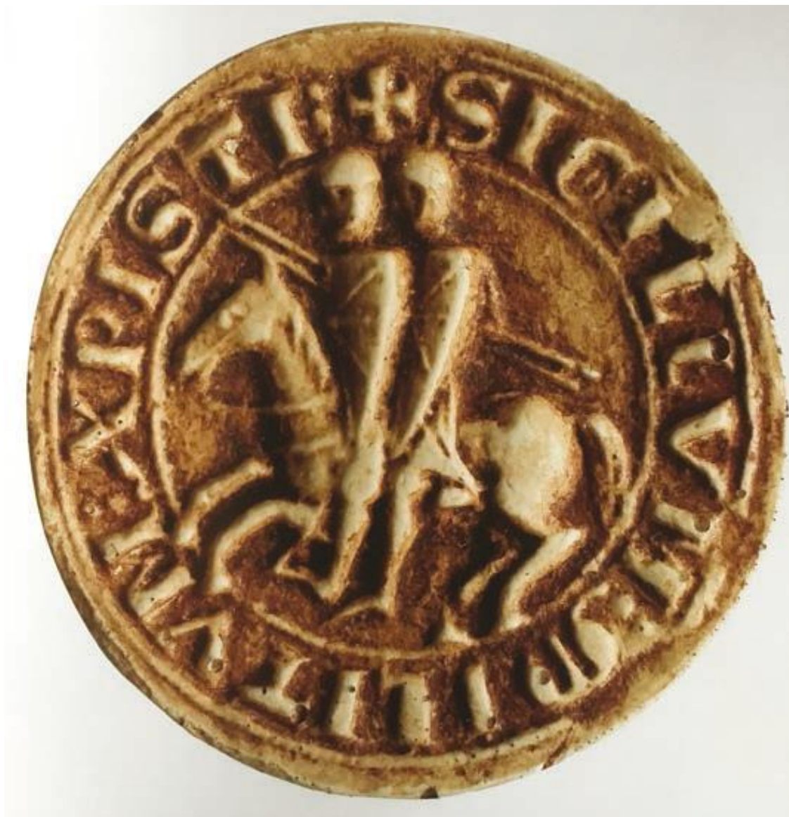
Два рыцаря на одном коне

Печать магистра Бертрана де Бланифорта, принятая в 1168 г.