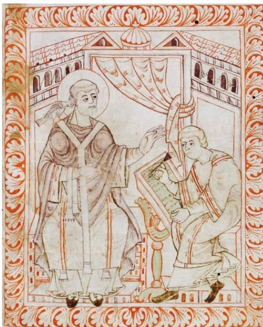
Папа Григорий I диктует григорианский хорал Библиотека бенедиктинского аббатства Санкт-Таллена, Швейцария. Фото репродукции

Таким образом, папа Григорий создаст чудесную смесь: он возьмет христианство в его самом чистом виде, какой только можно найти, возьмет все, что можно, из греческой традиции , все, чему научился за годы своей бенедиктинской жизни, и возьмет знания кельтов в сфере строительства.