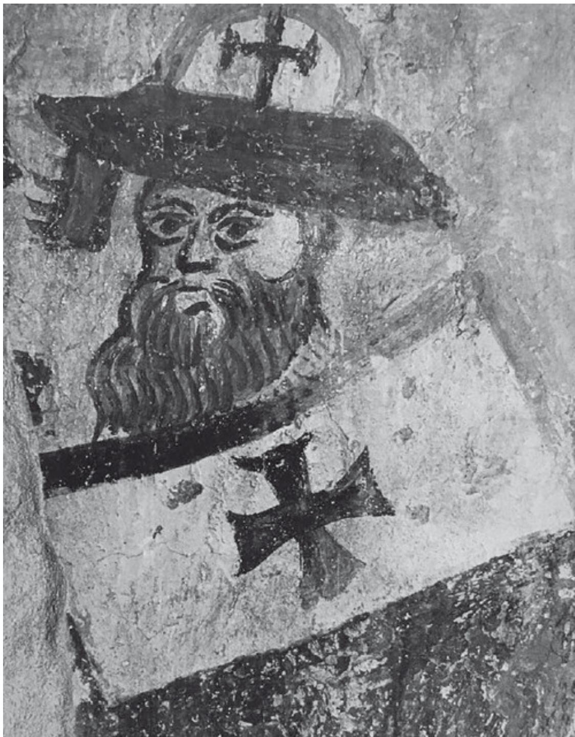
Тамплиер Фрагмент фрески в церкви ордена Храма. XIII в. Сан-Бевиньяте