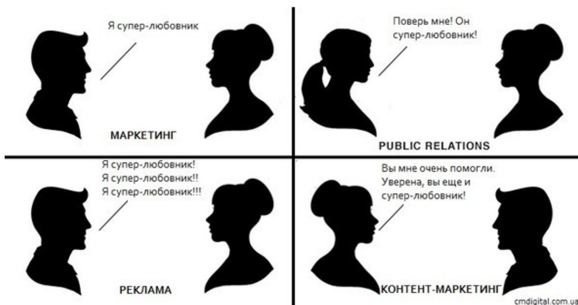
Старый комикс на новый лад

Сегодня часто встречается разное понимание, а точнее, восприятие контент-маркетинга. Для одних это очередная эволюция поисковой оптимизации, нечто, приходящее на смену традиционному SEO и линкбилдингу. Другие полагают, что контент-маркетинг – это синоним копирайтинга. Третьи не видят разницы между маркетингом в социальных сетях (SMM) и контент-маркетингом.