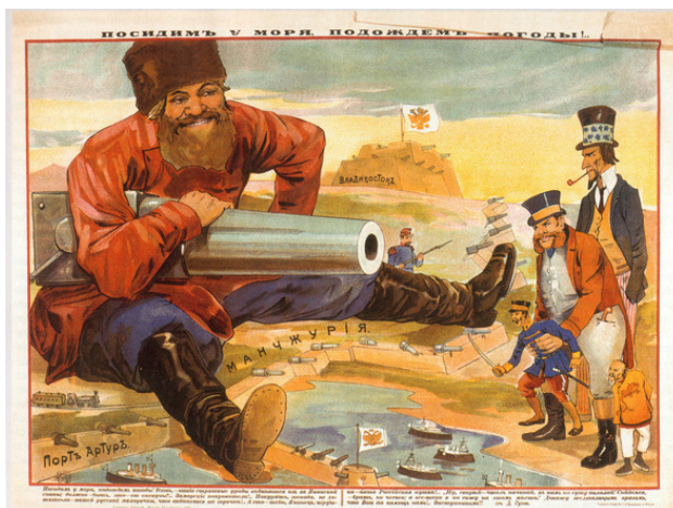
Плакат времен Русско-японской войны

Война с Японией тоже не добавляла очков правительству – тактика «посидим у моря, подождем погоды» привела к тому, что 20 декабря, после почти годичной блокады, был сдан Порт-Артур и практически полностью потерян тихоокеанский флот. Десятки тысяч вырванных мобилизацией из хозяйства рук, тянувшихся в сопки Маньчжурии, полупарализовавших движение по Транссибирской железнодорожной магистрали и возвращавшихся обратно тысячами раненных, только усугубляли общее недовольство текущим положением дел. И уже самому непрестальному наблюдателю становилось понятно, что перемены неизбежны. Кто-то ждал их со страхом, кто-то с нетерпением и твердой уверенностью в их необходимости. К концу 1904 года общая атмосфера в стране настраивала на революционный взрыв буквально со дня на день.