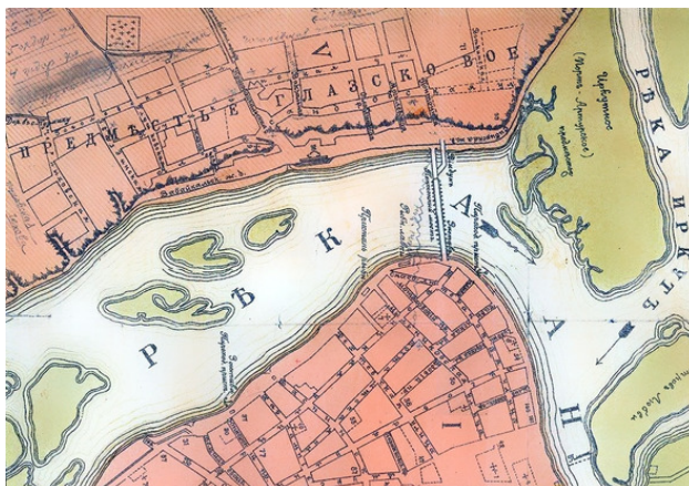
Глазковское предместье на плане Иркутска 1908 г.

«В толпе говорили, что в лавочке найдены три винтовки, башлык, папаха и др. солдатские вещи. Толпа все сокрушала: разбивала двери, выворачивала полы, все ища чего-то» 31 .