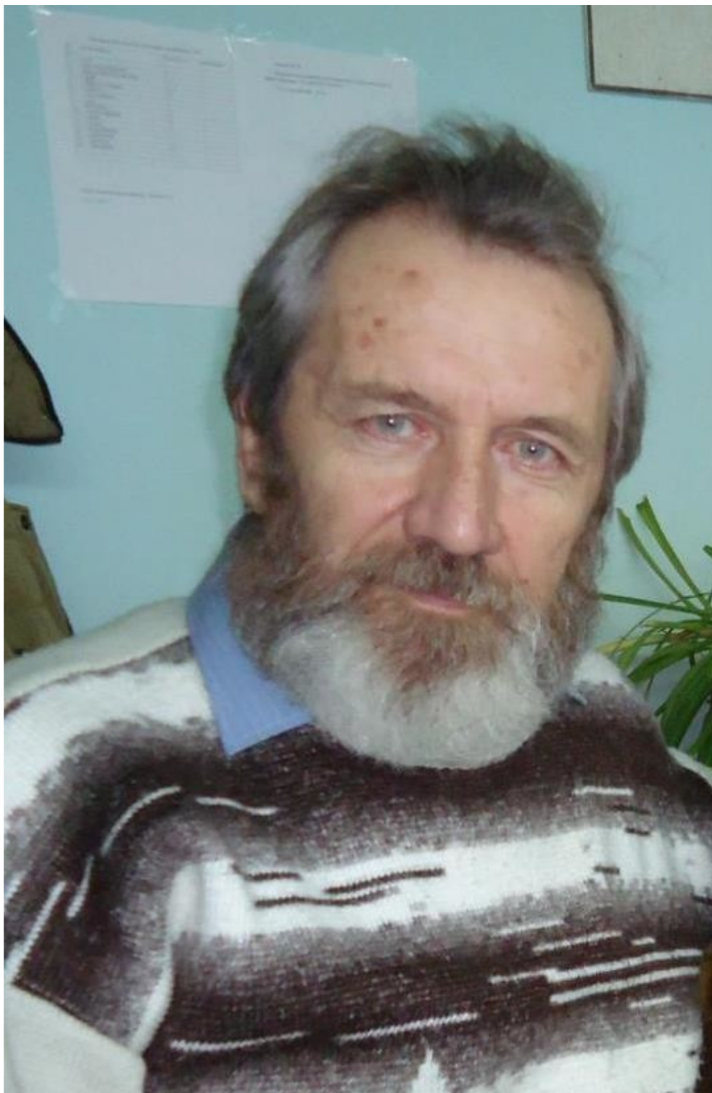
АВТОР –ИВАНЧЕНКО АЛЕКСАНДР ИВАНОВИЧ