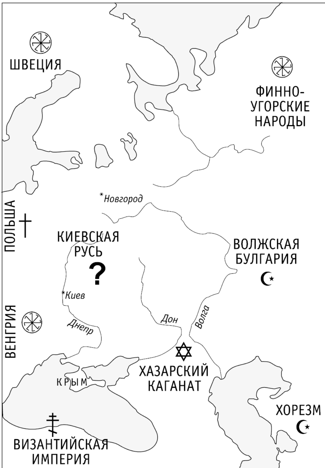
Киевская Русь и ее соседи в X веке