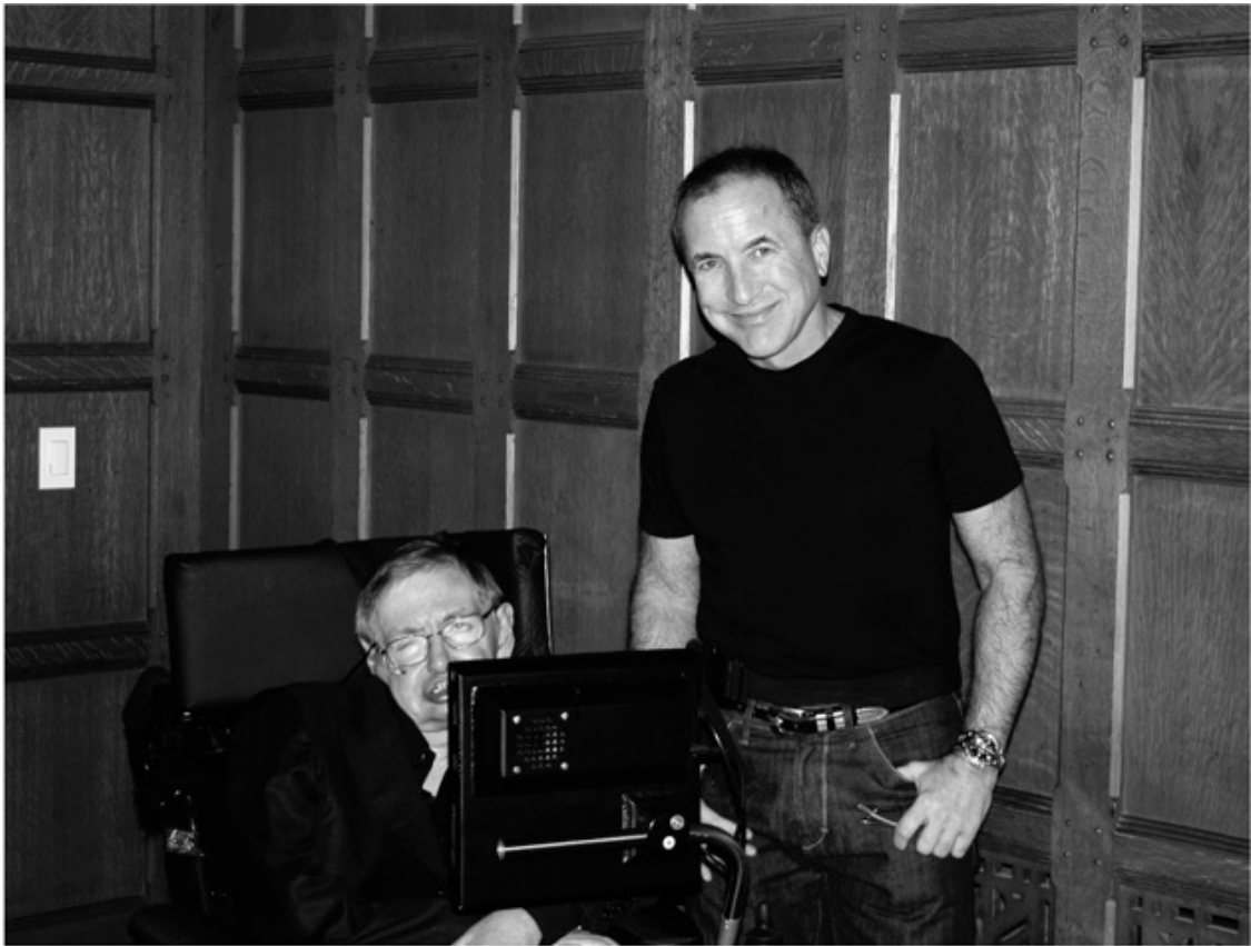
Илл. 4.1. Автор со Стивеном Хокингом

более 10 млн экземпляров по всему миру, переведена более чем на 30 языков. Последняя работа Хокинга «Мир в ореховой скорлупке» ( The Universe in a Nutshell ) уже заняла прочную позицию в списке бестселлеров New York Times .