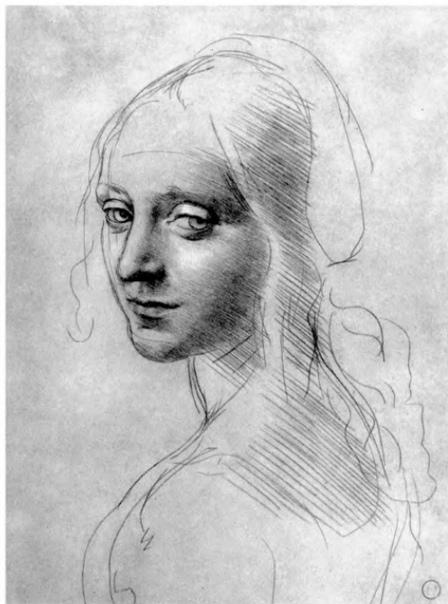
Рисунок Леонардо да Винчи

– И про эту летучую мышь, – сказал себе тихо Леонардо. – Отчего она летает только ночью, отчего она днем ничего не видит и отчего она не летает так легко, как ласточка или голубь? Хорошо все, все знать!