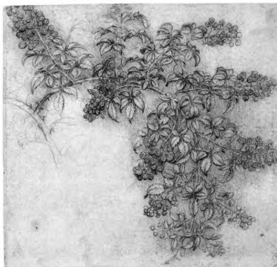
Рисунок Леонардо да Винчи