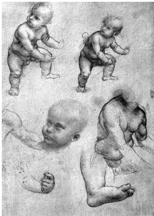
Рисунок Леонардо да Винчи

Нотариус развернул сверток картона: в нем были рисунки Леонардо. Он нес их по улице так бережно, как будто они были сделаны из паутины, и теперь с гордостью разложил их перед Верроккьо, хотя сам не много понимал в искусстве. Он немножко струсил за своего кумира Леонардо, когда заметил, что художник медлит с ответом.