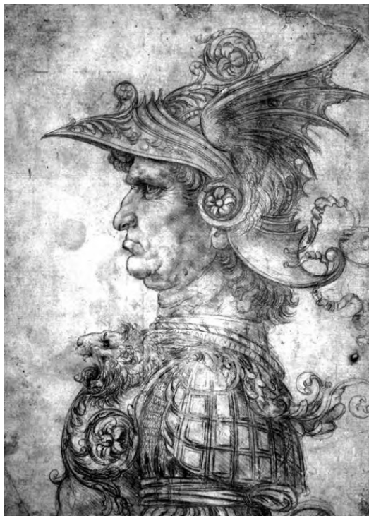
Рисунок Леонардо да Винчи

На вилле Кареджи, около Флоренции, жил широкой жизнью Лоренцо Медичи, прозванный Великолепным. В его роскошном дворце пиры сменялись пирами; аллегорические процессии, устраиваемые лучшими художниками Флоренции, сменялись блестящими турнирами, гремевшими далеко за пределами Италии. На эти турниры съезжались все знатные гости итальянских государств, вельможи, герцоги, рыцари из далеких чужеземных стран.