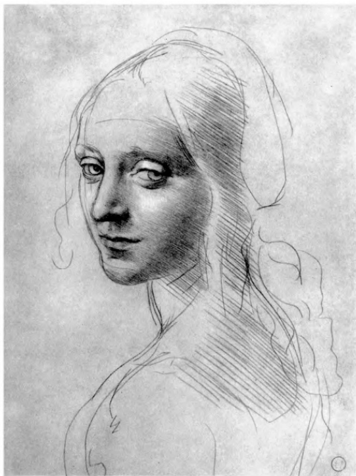
Рисунок Леонардо да Винчи

– И про эту летучую мышь, – сказал себе тихо Леонардо. – Отчего она летает только ночью, отчего она днем ничего не видит и отчего она не летает так легко, как ласточка или голубь? Хорошо все, все знать!