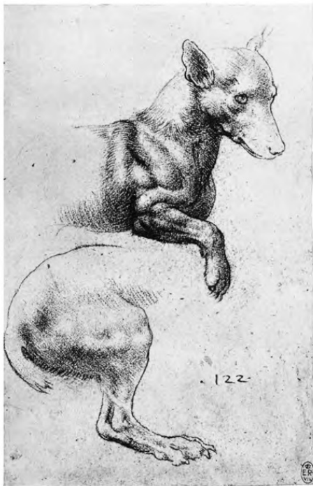
Рисунок Леонардо да Винчи

Его радовал и пугал этот ребенок, так богато одаренный природой. Художник ясно видел, что через несколько лет взойдет новая звезда, звезда Леонардо, и она затмит его славу. Но он никогда не унижался до постыдной зависти. С грустной нежностью старался он стать как можно ближе к этому странному мальчику, доброму, любящему и в то же