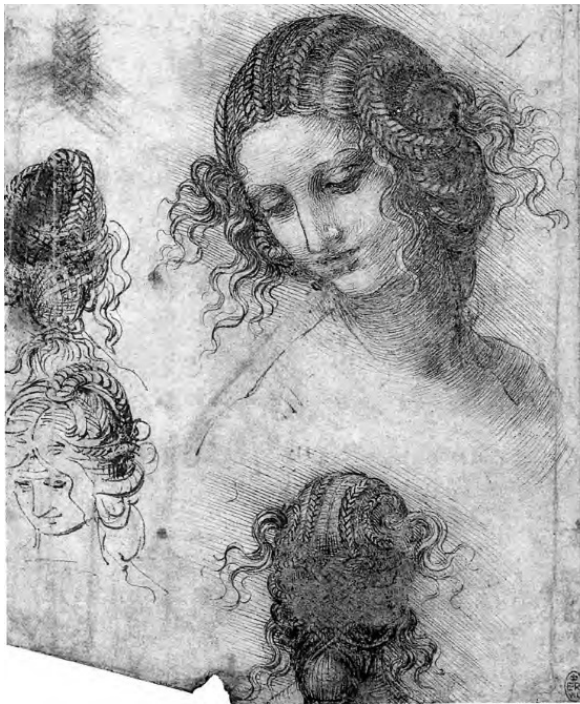
Рисунок Леонардо да Винчи

Ему рукоплещут. Сама Бианка Пацци кидает ему розы, украшающие ее нежную шею. Но вот уже и лютня в руках Леонардо, вот уже сильным и звонким голосом начинает он радостную, торжественную песнь.