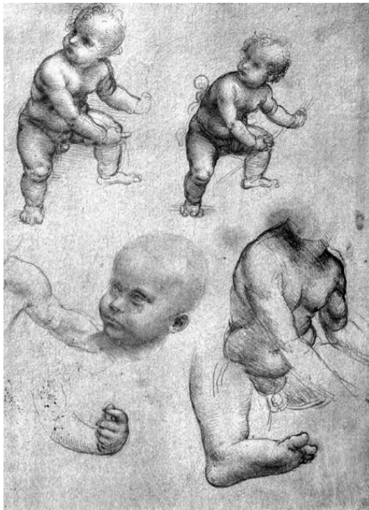
Рисунок Леонардо да Винчи

– Видишь ли, – начал нотариус, точно извиняясь, – мальчуган-то того... не то чтобы он дурно учился, но он непоседлив, как кукушка, хе-хе-хе... и из него не выйдет мне преемника. У него только пение, рисование да эта астрология на уме. Я вот и подумал, что не худо бы... того... отдать его к тебе на выучку. А ведь недурны рисунки, и у мальчика, ка-