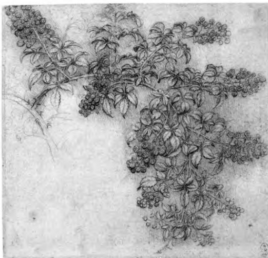
Рисунок Леонардо да Винчи

– Или возьми голову мыши и, высушивши, носи на себе... Она опять подумала.