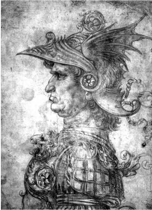
Рисунок Леонардо да Винчи

за пределами Италии. На эти турниры съезжались все знатные гости итальянских государств, вельможи, герцоги, рыцари из далеких чужеземных стран.