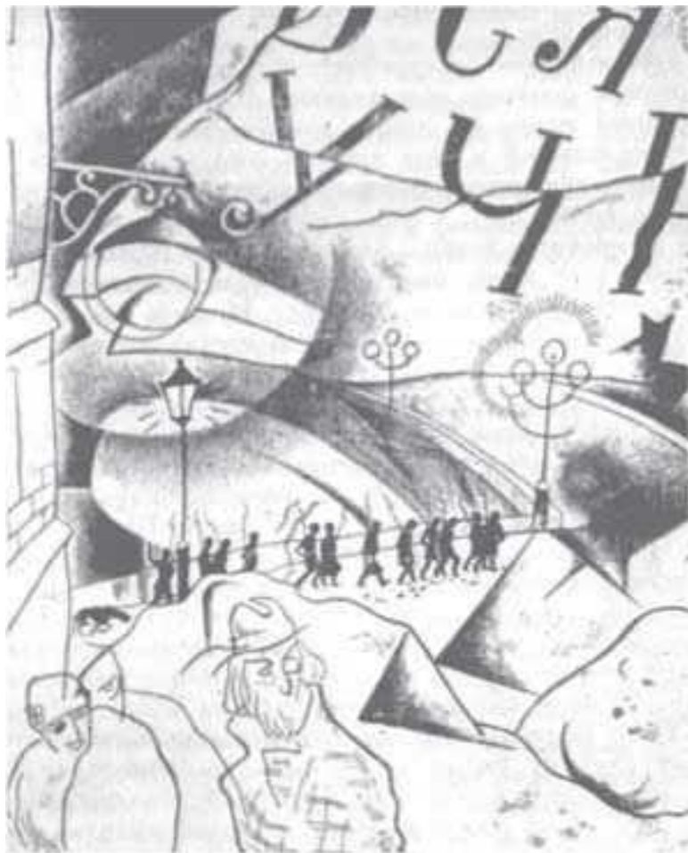
Составитель серии Давид Рудман