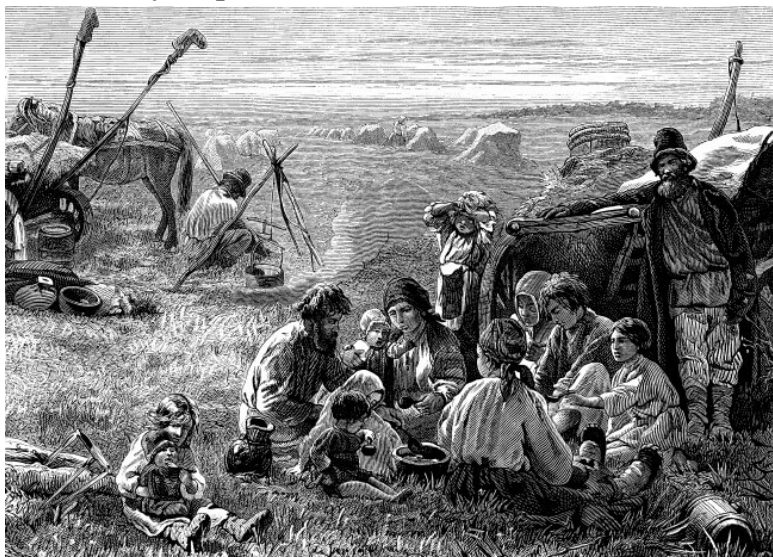
В. Е. Маковский. Жнитво

сравнительно малых денежных затратах получен был результат несомненной выгоды, как видно из подлинных отчетов о расходе и приходе. Введено было многополье, хорошее, даже обильное удобрение, заведены были машины, и устроено было правильное скотоводство, чтобы использовать луга и иметь свое удобрение.