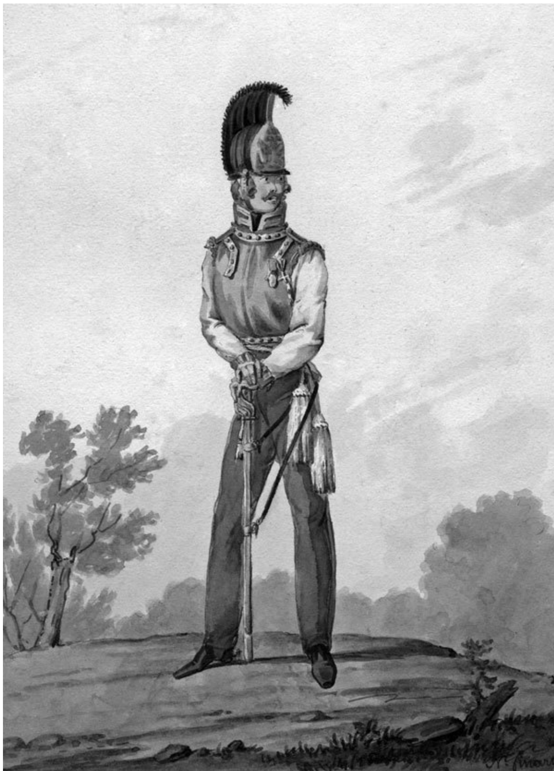
Карабинер-офицер российской императорской гвардии. 1815

Начальник, не щадящий самолюбия своих подчиненных, подавляет в них благородное желание прославиться и тем роняет их нравственную мощь.