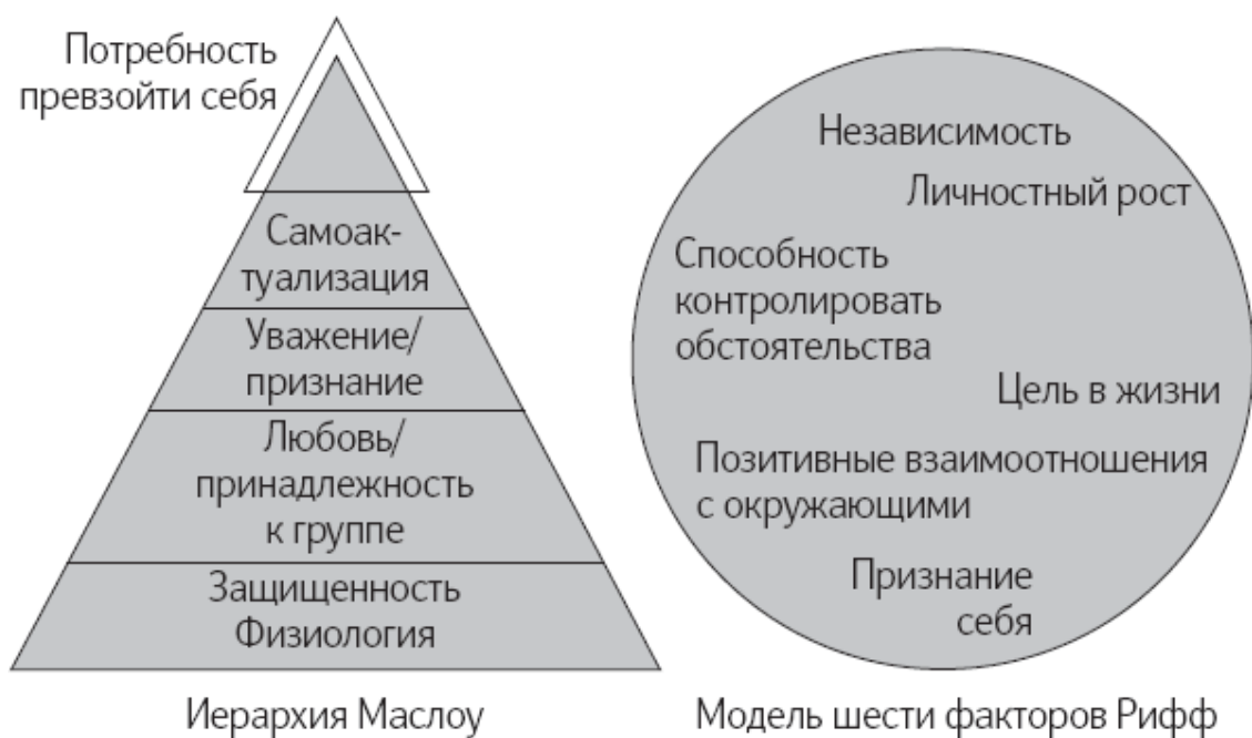
Рис. 2. Что требуется для психологического благополучия

Для них нет иерархии, хотя они близки потребностям, установленным Маслоу (рис. 2). Эти категории – традиционный предмет изучения психологов, занимающихся эмоциональным и психологическим функционированием, но именно по ним нужно проверять, требуется ли некоторым областям вашего психологического благополучия уделять больше внимания, чем другим.