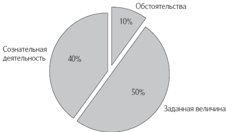
Рис. 1. Компоненты уровня счастья

Позитивные психологи Шелдон, Любомирски и Скотти создали формулу счастья, которая разбивает данные исследований на три категории – компоненты общего уровня счастья (рис. 1):