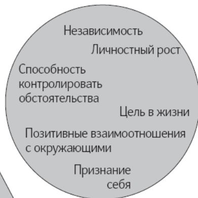
Модель шести факторов Рифф