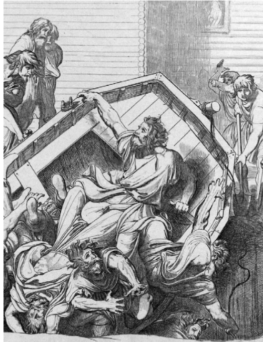
Мсть Ольги древлянам за смерть мужа (гравюра Ф. А. Бруни, 1839)

пока те совершенно не захмелели. Тогда княгиня приказала дружинникам всех перебить. По словам летописца, в ту ночь было убито пять тысяч древлян.