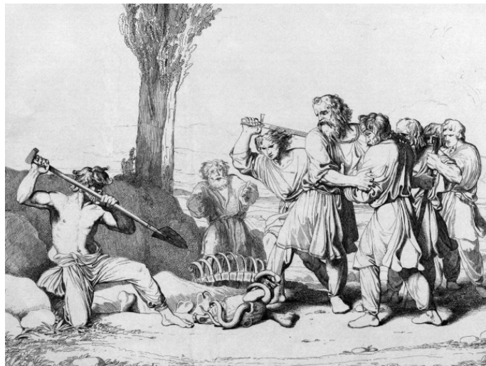
Веций Олег, отец Игоря погиб от укуса змеи (гравюра Ф. А. Бруни, 1830)

11 июля 969 года великая княгиня скончалась, «и плакали по ней плачем великим сын ее и внуки и все люди». Святая равноапостольная Ольга, принявшая в крещении имя Елена, что означало «солнечный луч», была канонизирована на соборе 1547 года. Ее имя навсегда осталось в истории, а сама она оказала огромное влияние на внука Владимира, который воплотил ее мечту в жизнь, крестив Русь.