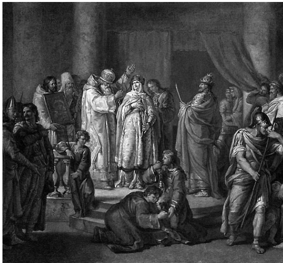
И. А. Акимов «Крещение княгини Ольги в Константинополе» (1792)

Житие повествует, что «управляла княгиня Ольга подвластными ей областями Русской земли не как женщина, но как сильный и разумный муж, твердо держа в своих руках власть и мужественно обороняясь от врагов. И была она для последних страшна, своими же людьми любима, как правительница милостивая и благочестивая». Справедливая в своих решениях, Ольга пресекала произвол, смердам более не надо было прятать от княжеских тиунов свое добро, а то и скрываться самим от участи еще более горькой – веревки, которую накинута на шею и потащат за нее в рабство, на продажу в Царьград.