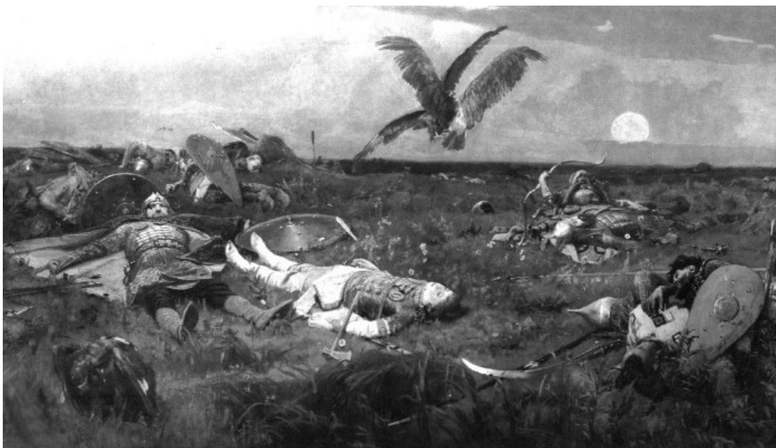
В. М. Васнецов «После побоища Игоря Святославовича с половцами» (1880)

Естественный ход событий был за Ольгой и ее реформами. Ее правление стало едва ли не самым спокойным и мирным в истории Древней Руси. Родовая община распадалась, уходила в прошлое. Из отдельных поселений, городков и маленьких крепостей на востоке Европы постепенно выросло сильное сплоченное государство. Административные изменения подкреплялись экономическим ростом, рос и политический вес Киева на карте мира. И как мудрая правительница Ольга не могла не понимать: мало одних забот о хозяйстве и дипломатии. Для сплочения народа нужна единая вера.