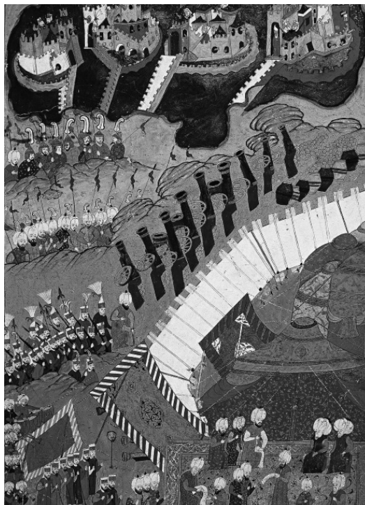
Османские войска атакуют венгерскую крепость» (неизв. худ., XVI в.)

И очень удивился Сулейман, когда из предложенных в награду милостей молодая красавица попросила только одного: позволения посещать библиотеку. Зачем султанской наложнице книги? Но Роксолана знала, что никто и никогда не выпустит ее на волю. А оставаться одной из сотен женщин, с годами все реже призываемых повелителем, она не желала. Путь был один – стать для султана особенной, единственной, и она твердо решила его пройти.