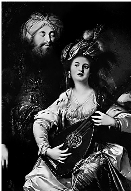
За легкий нрав и любовь к музыке ее прозвали «Хюррем» (веселая) (худ. А. Хикель, 1780)

Они обсуждали все: политику, искусство, любовь, часто при этом общались стихами.