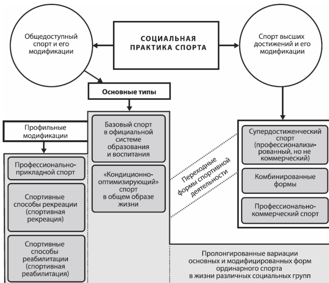
Рис. 2.1. Принципиальная схема структуры социальной практики спорта (направления, разделы, формы) (Л. П. Матвеев, 2010)

социально-демографических групп, на которые он ориентирован, и тех задач, которые применительно к ним призван решать. Основными критериями для классификации выступают цель функционирования и основная потребность, удовлетворяемая каждым направлением спорта как особым социальным институтом.