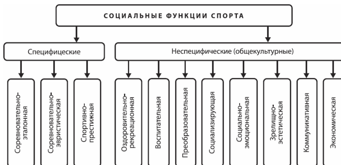
Рис. 1.2. Социальные функции спорта