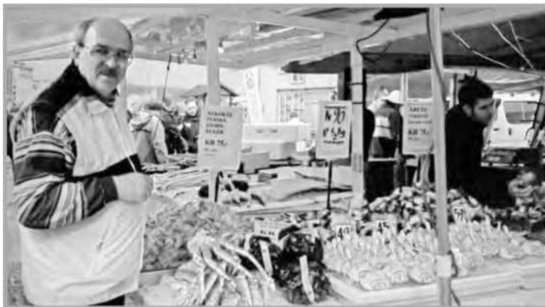
Рядышком со всякими ракообразными в Норвегии.

Самое начало пятидесятых годов. Отец всегда приходил домой с работы довольно поздно. Обычно мама готовила ему на ужин что-то горячее. Но иногда по каким-то причинам не успевала, и тогда меня посылали в недавно открытый рядом с нашим домом на Песчаной улице гастроном № 6 с поручением купить баночку крабов «Чатка» – никаких других, впрочем, тогда и не производилось. Где-то я прочитал, что свое название они получили благодаря типографской ошибке. Надо было напечатать «Камчатка», но три первых буквы «по недоглядке» потерялись. Кому-то из начальства это даже понравилось, и решили так и оставить. Может быть, это лишь досужая выдумка, но нельзя исключать, что и правда. У нас и не такие диковинные вещи случались.