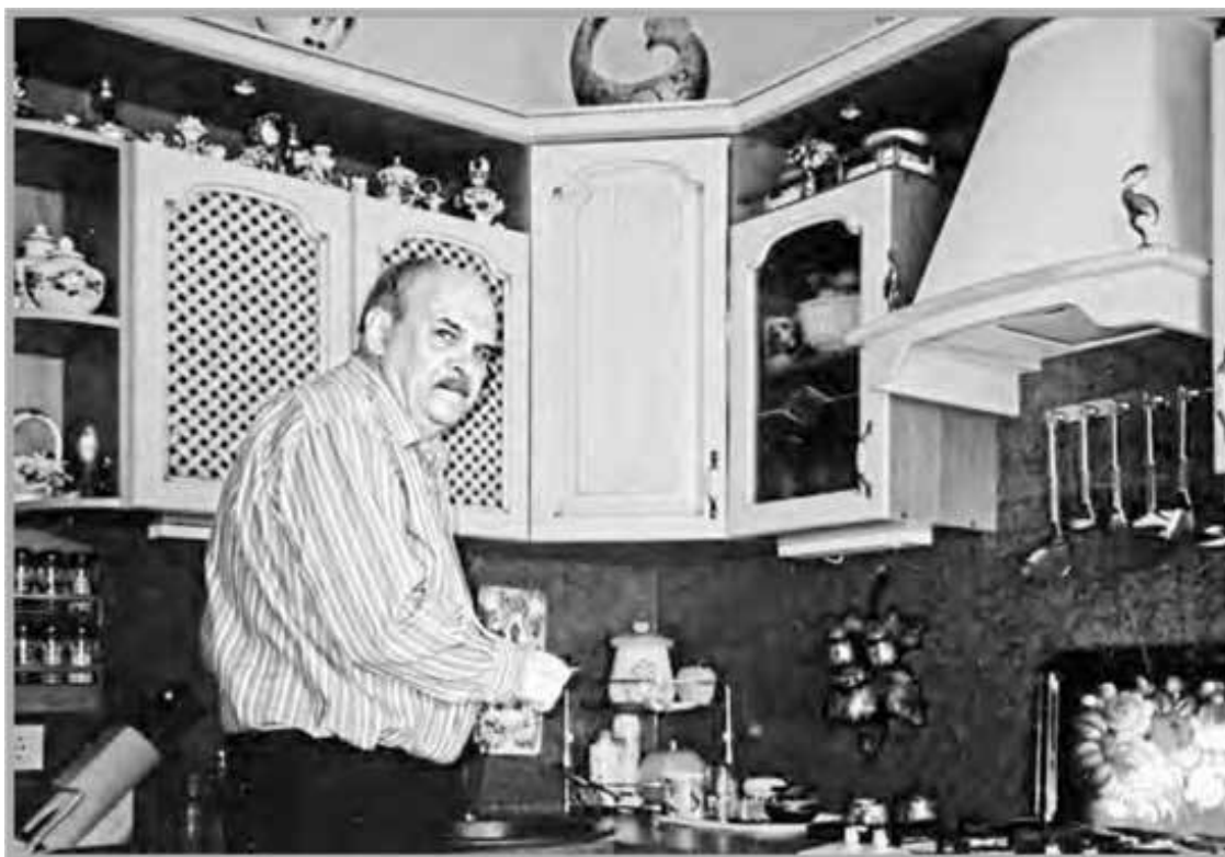
Любимое место автора в квартире – кухня.

Далее поговорим немного о следующем вопросе из моего списка – когда пишутся мемуары? Прежде всего, видимо, тогда, когда у будущего автора накопилось достаточное количество интересных воспоминаний, с которыми ему не терпится ознакомить широкие читательские круги. Но для их написания требуется немало досужего времени. А как быть тому, кто не является представителем свободной профессии (или не располагает необходимым штатом соответствующих помощников-консультантов)? Выход один – дожидаться ухода на заслуженный отдых. Именно так и произошло в моем случае. Правда, вот здесь-то у меня и начали возникать всяческие сомнения.