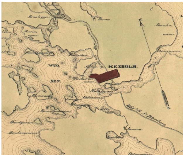
Кексгольм. Фрагмент Шведской карты 17 века.

История земли повернулась так, что этот город получил название Кексгольм и 15 лет находился под властью шведов с 1580 по 1595 год.