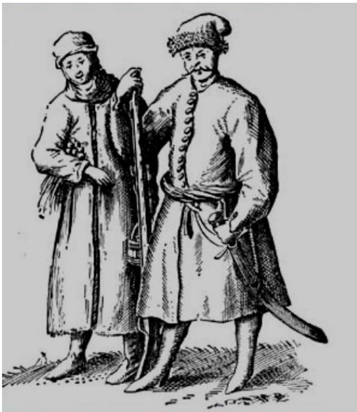
Казак и казачка. Неизвестный художник 17 века.

В книге историка А.И.Назарова « Антропонимикон яицких казаков XVII века. » видим, что внук Андрея Корелы, носил фамилию Корелин (тогда говорили КОРЕЛин сын). Возможно, что и Олимпийский чемпион по вольной борьбе Александр Александрович Карелин, Герой Российской Федерации происходит корнями от этих казаков.