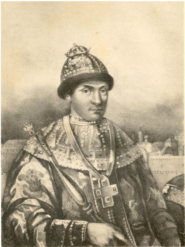
Царь Феодоръ Иоанновичъ

Съ портрета иллюстрирующаго въ Кунсткамерѣ Академіи Наукъ.