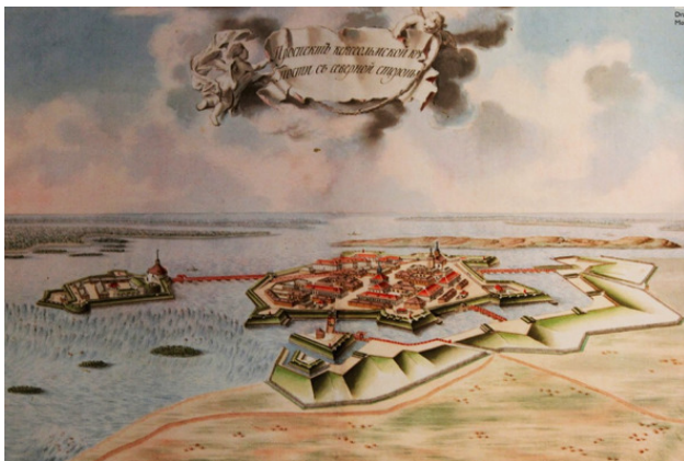
Рисунок крепости Кексгольм 18 век. Неизвестный художник.

Но наступило время, когда весь город был уже объят пламенем, и его защитникам ничего больше не оставалось, как сложить оружие или погибнуть в огне. Только в этот критический момент воевода согласился начать переговоры и послал двух воинов в шведский лагерь. В результате переговоров город был сдан шведам, а оставшимся в живых защитникам Корелы и ее жителям было предоставлено право уйти в русские владения.