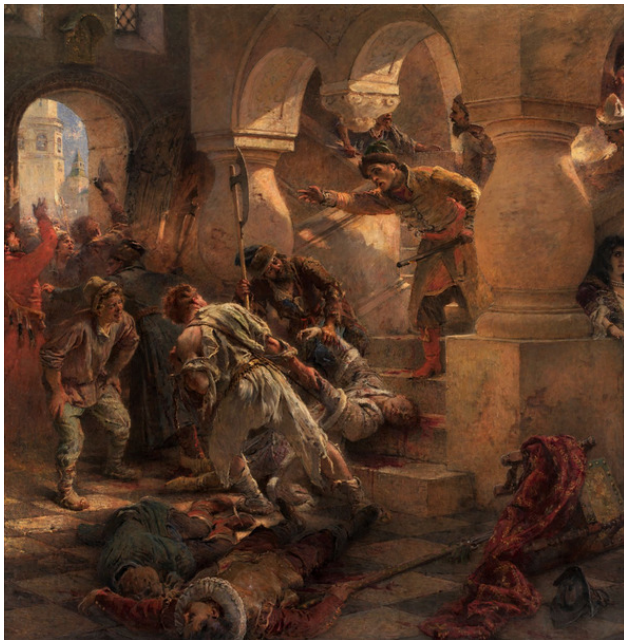
Убийство царевича. Художник К. Е. Маковский.

Как только это свершилось, молодые дворяне подняли на дворе сильный вопль. И известие тотчас дошло до канцелярии, а потом распространилось по всему городу. Каждый кричал: «Разбой, извели царя!» И многие вскочили на лошадей и сами не знали, что предпринять; другие бросились на двор, схватили здесь всех – и дворян и недворян – и заточили до той поры, пока Москва не узнает об убийстве; между тем во время ужасного смятения многие были умерщвлены.