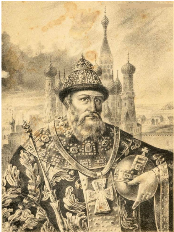
Царь Иванъ Васильевичъ Грозный Съ портрета имъющатася въ Кунсткамеръ Академіи Наукъ.

Художник Б. А. Зеленский из труда Висковатова А. В. «Историческое описание одежды и вооружения российских войск».