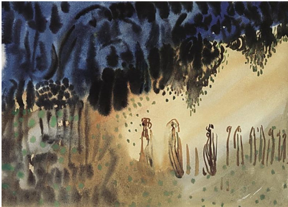
Мартiros Сарьян. Вечерняя прогулка. 1904. Бумага, акварель