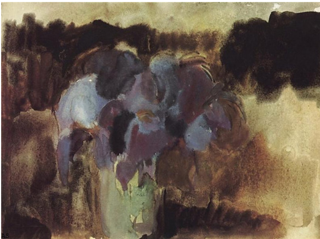
Мартiros Сарьян. Ирисы. 1903. Бумага, акварель.

Не идеализируя, не подтверждая и не оспаривая историю. О 24 апреля в Армении. То, что видели глаза.