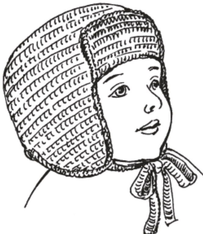
Рисунок 13. Шапка-ушанка

Отвернуть козырек вверх и пришить потайными стежками к основной части шапочки (рис. 13).