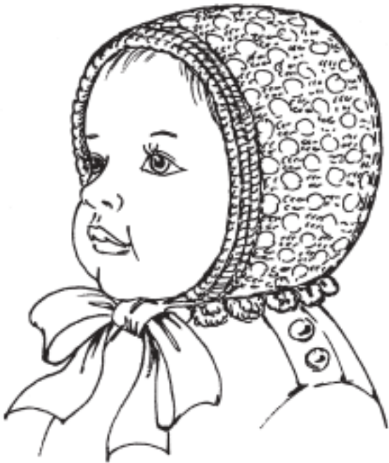
Рисунок 2. Чепчик ажурный для новорожденного