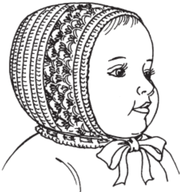
Рисунок 9. Чепчик с ажурной вставкой

Сквозь отверстия нижнего ряда продеть ленточку – набрать цепочку из воздушных петель длиной 40–50 см и обвязать столбиками без накида (рис. 9).