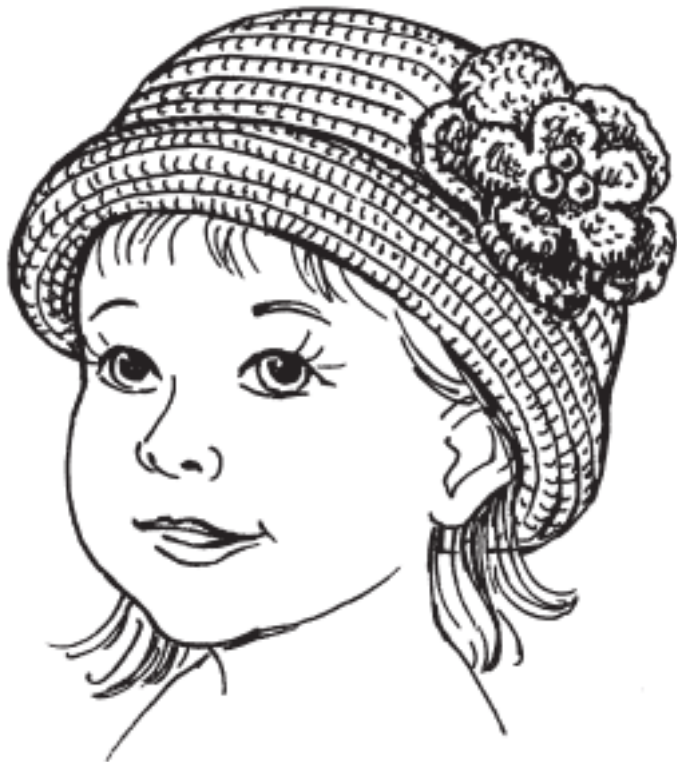
Рисунок 5. Шляпка для маленькой модницы