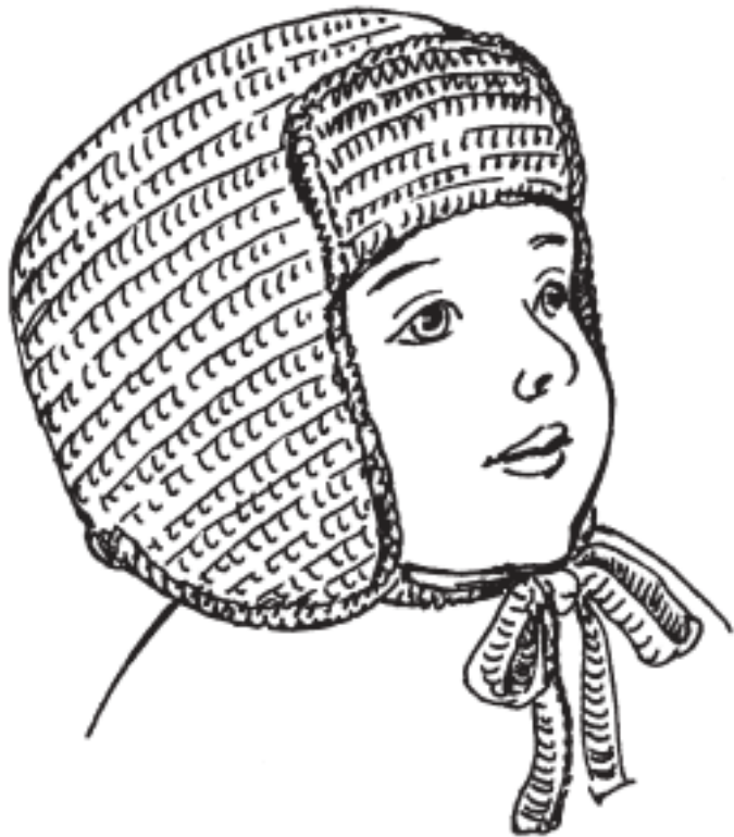
Рисунок 13. Шапка-ушанка