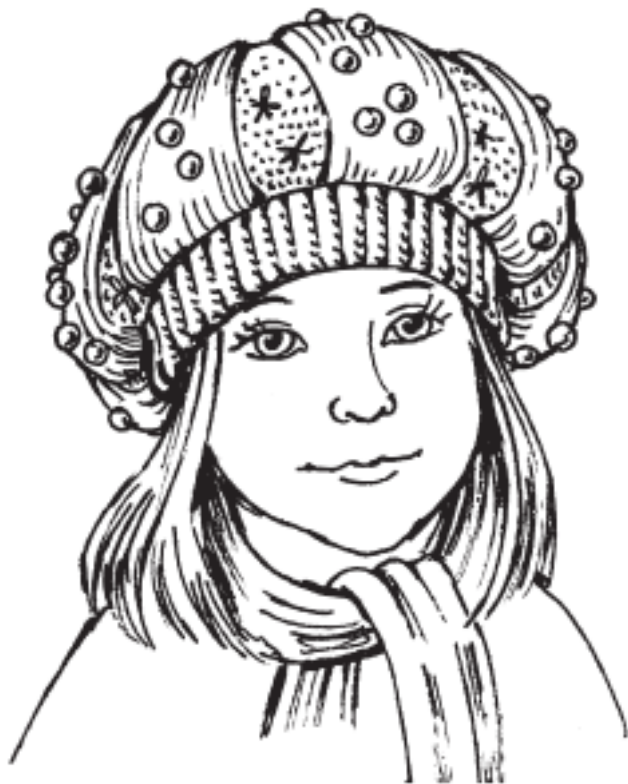
Рисунок 10. Беретик для девочки