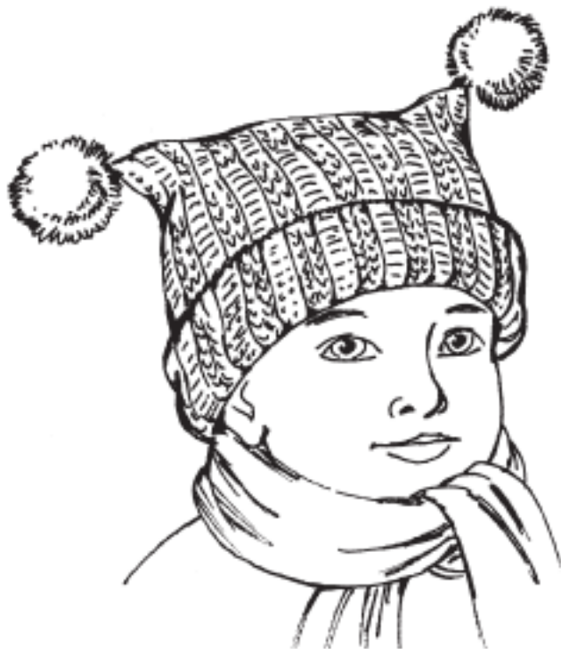
Рисунок 12. Шапочка с «рожками»