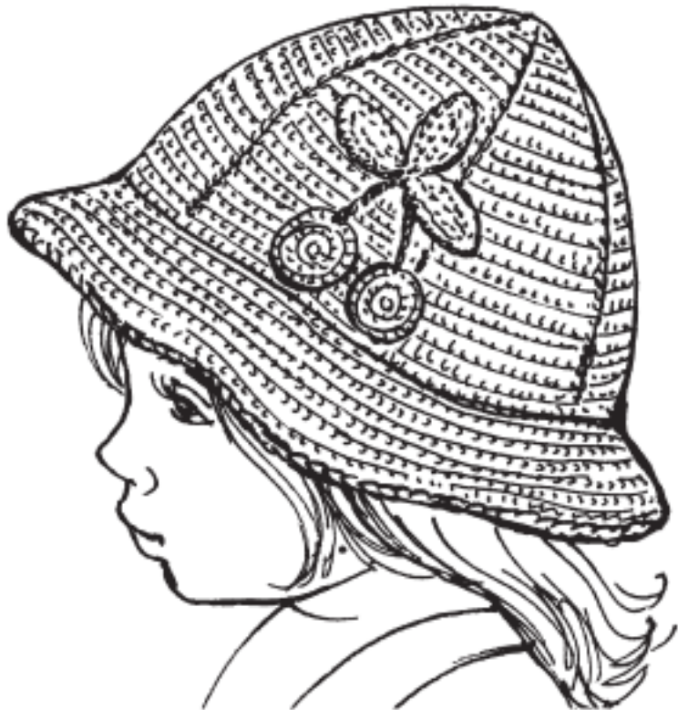
Рисунок 7. Летняя панама для девочки

Для прохладной осени и переменчивой весны