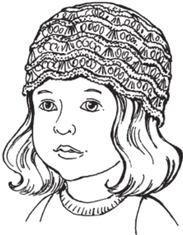
Рисунок 3. Шапочка для малыша