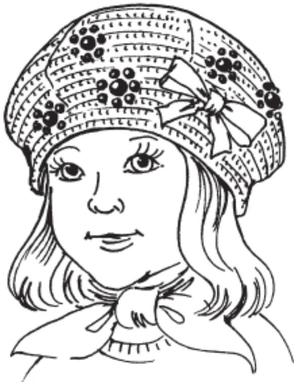
Рисунок 4. Берет универсальный

Классическая шляпка из хлопковой или льняной пряжи –