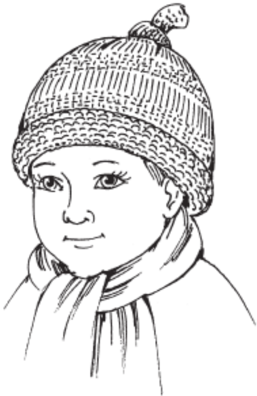
Рисунок 11. Шапочка с «хвостиком» для мальчика