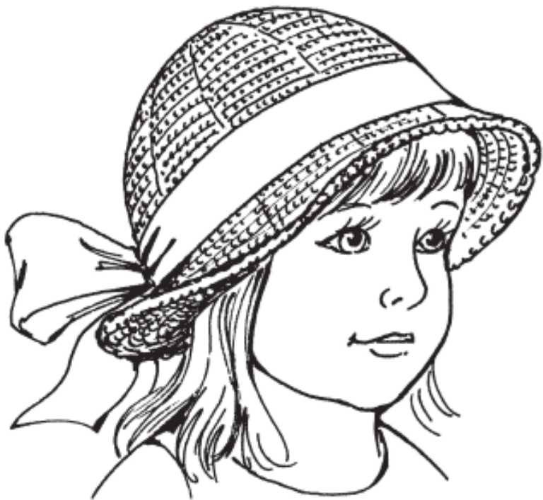
Рисунок 6. Шляпка для маленькой леди

сформировать большой бант и пришить его к задней части шляпки (рис. 6).