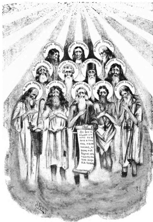
Христа ради юродивые