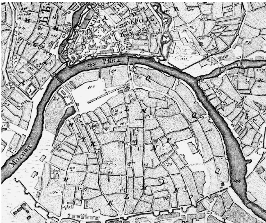
План Москвы архитектора Ивана Мичурина. 1739 г. Фрагмент

На месте Государева сада, погибшего в пожаре 1701 года, по приказу Петра был сооружен Суконный двор, изготавливавший сукно для нужд войск. Позади двора находился Царский луг, на котором во время торжеств пускался фейерверк. Недалеко от Земляного вала поселились монетных дел мастера. Ныне здесь находятся Монетчиковские переулки. На Крымском валу стоял Крымский двор с высоким забором – место встречи послов из Бахчисарая. В связи с увеличением торговых связей и роста московской торговли купцы все чаще переезжают жить в Замоскворечье, а лавки их остаются в Китай-городе. Вся территория до Земляного вала была освоена, исчезли поля и выгоны для скота.