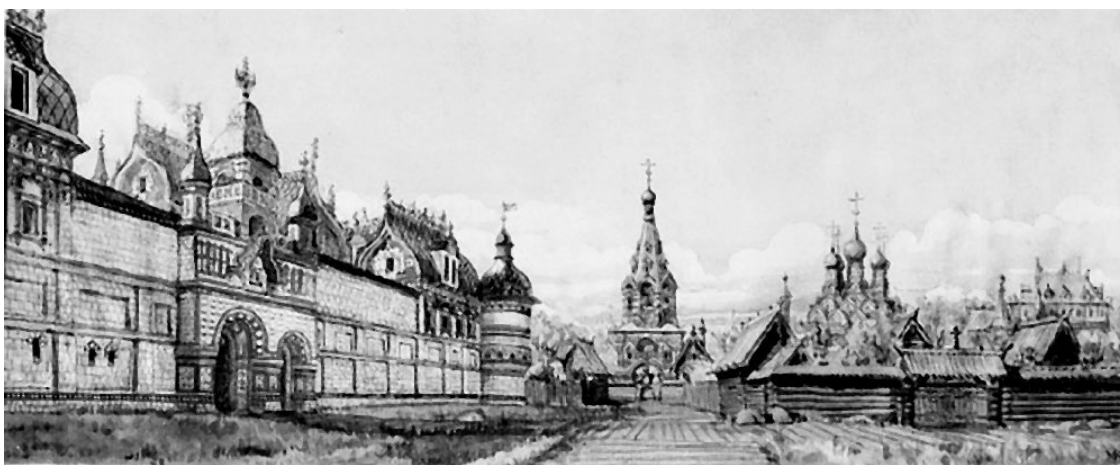
Кадашевский ткацкий двор. Художник М. П. Кудрявцев

В Москве были дворцовые, казенные, черные, владычные, иноземческие и военные слободы – всего около ста пятидесяти слобод, расположенных во всех районах города, за исключением Кремля. Объединение людей в слободы происходило либо по роду занятий, либо по национальному признаку. Иностранные путешественники, бывавшие в Москве, удивлялись пестроте и многоликости московских слобод. Например, по воспоминаниям неизвестного иностранца, у него в одной слободе за большие деньги купили табак, а в другой – чуть не побили за это же дымное зелье. Одной из самых примечательных, своеобразных и колоритных слобод была Кадашевская слобода в селе Кадашеве.