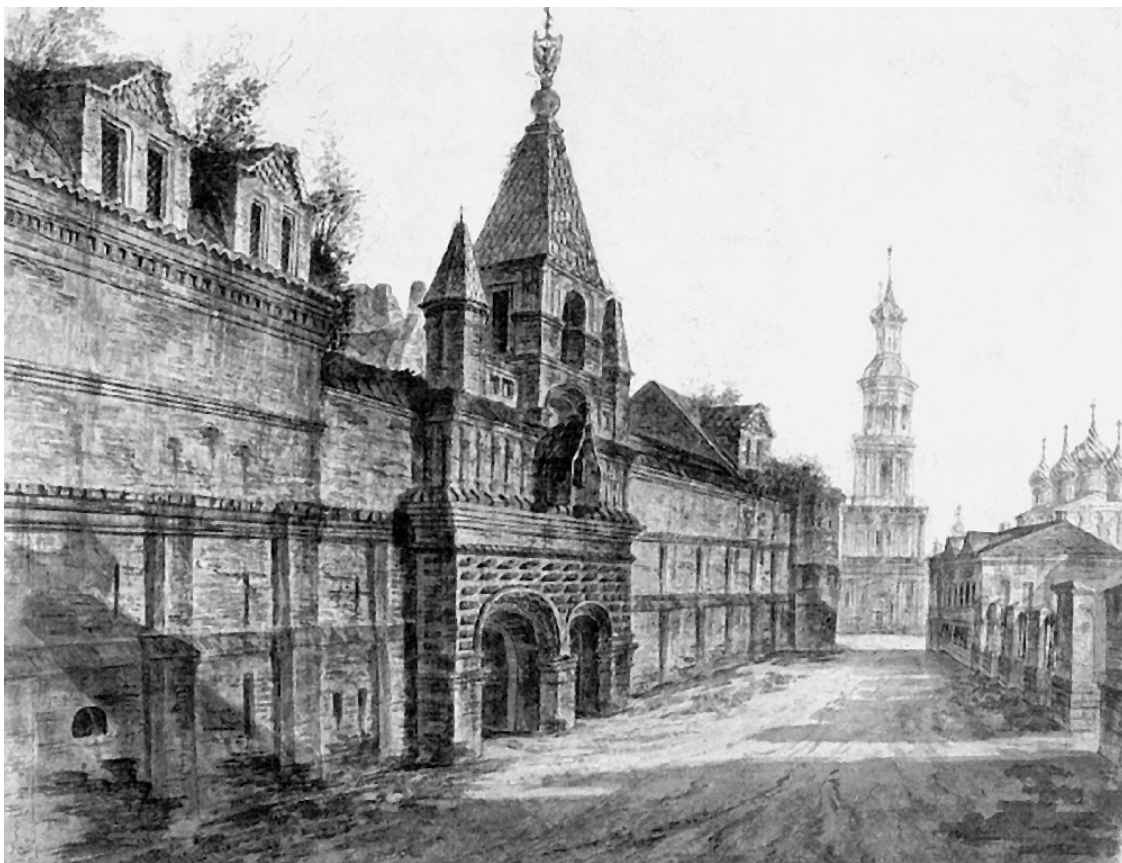
Вид в Замоскворечье на Кадашевский Хамовный двор и колокольню церкви Космы и Дамиана. 1800-е гг. Художник Ф. Я. Алексеев

Во время Петровских реформ облик Замоскворечья меняется. Петр подавил стрельцкий бунт и расформировал стрелецкое войско. Часть стрельцов была казнена, другие распределены по разным полкам. Их земли были отданы военным, купцам и мелким чиновникам. Когда столицей России становится Петербург, ремесленники и жители слобод (овчинники, кузнецы и хамовники) теряют своего главного заказчика – царский двор и практически лишаются источника существования. «На Пятницкой улице появляются дворы богачей, деревянные хоромы которых скрывались за выходившими на улицу заборами и садами. Однообразие замоскворецкого пейзажа нарушалось красивыми церквями, выстроенными купцами и еще ранее стрельцами» 12 , – пишет П. В. Сытин в книге «Из истории московских улиц».