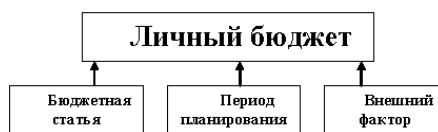
Рис. 1.2. Основные элементы личного бюджета

Схематично структура личного бюджета показана на рис. 1.2.