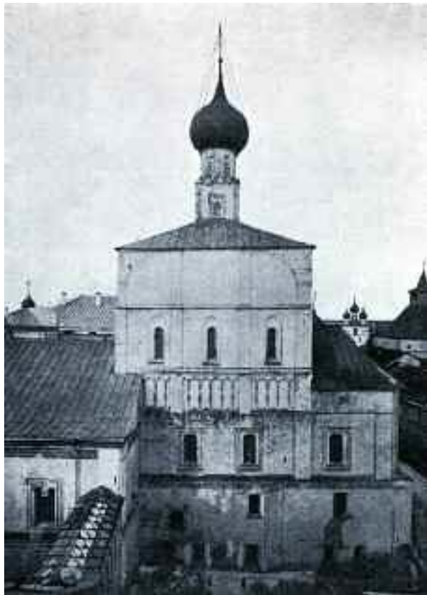
Церковь Спаса «на сѣняхъ» «Бѣлой палаты». (снятая до реставрации).