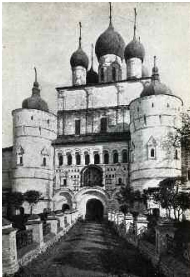
Церковь Воскресения на сѣверныхъ святыхъ воротахъ митрополии.