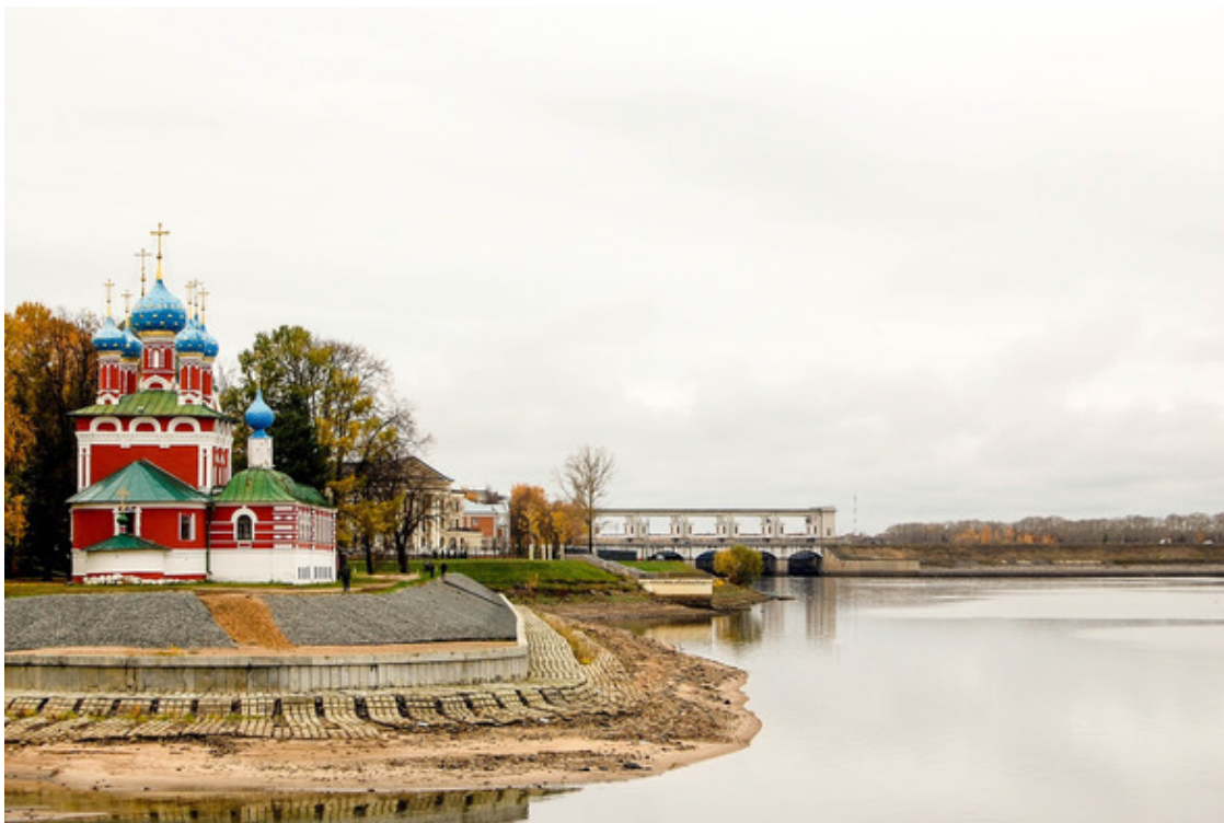
Углич, Угол, Волга... Церковь царевича Димитрия «на Крови»

Почти все Углицких родом с западного Урала, где и проживают более или менее компактно в Красновишерском районе Пермского края. Но особенно много их в деревне Федорцовой, расположенной совсем неподалеку от места впадения реки Язьвы в реку Вишеру, что в нескольких десятках километров от старинного купеческого города Чердыни, в шестнадцатом веке – столицы Урала. Откуда пришли на берега Вишеры эти самые Углицких, отколы переселились, история, подоплека и обстоятельства переселения этого и станут предметом нашего дальнейшего разбирательства.