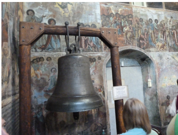
«Карнаухий» колокол в Церкви Дмитрия «на крови»

О том, что все Углицких имеют отношение к угличским событиям 1591 года я впервые услышал еще в далеком детстве. От отца, братьев его и сестер, от иных вишерских родственников, гостивших у нас в Перми. Рассказывалось одно и то же наше, фамильное, семейное предание, что давным давно жил, де, царь Федор, что убили в городе Угличе младшего братика его – царевича – мальчика, по имени Дмитрий (Митрий, Димитрий). Что разгневанные угличане самосудно казнили убийц. Что горожан тех оклеветали, перед царем Федором, который и повелел в наказание сослать их за Уральский камень. Что после отбытия немилости ссыльные остались на Урале, на Вишере, основав поселение свое, названное ими в честь царя Федора – деревней Федорцовой, из которой все мы, Углицких, и приходим. Обычно рассказ завершался демонстрацией паспорта очередного рассказчика, в котором в графе «Место рождения» значилось одно и то же: «село Федорцово, Красновишерского района Пермской области».