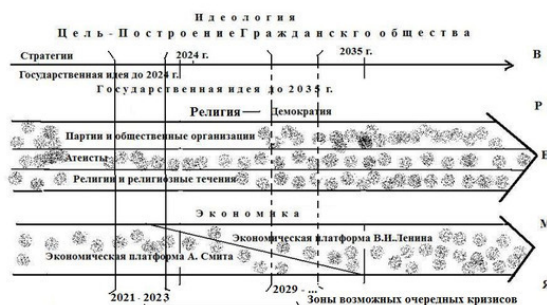
Рисунок. Методология построения стратегий и программ

Сразу предупредим читателя, что для разработки полноценной стратегии на уровне государства как следует из названия книги, она должна содержать три составляющих: идеологию, религию и экономику. Общая методология построения стратегий показана на рисунке.