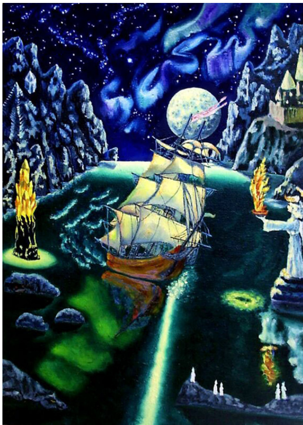
Корабль из Атлантиды. Андреева Г. В.

Путь прожигаю свой Сквозь сумрак мира. Два спутника со мной: Меч Духа за спиной, А в сердце – Лира!