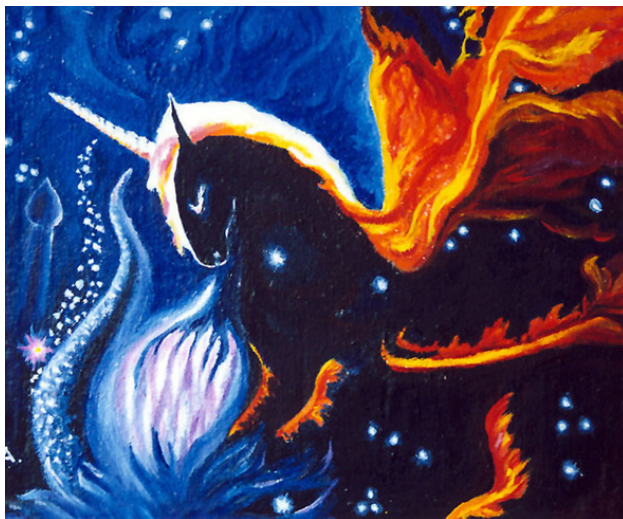
Космический Единорог Трифид. Андреева Г. В.