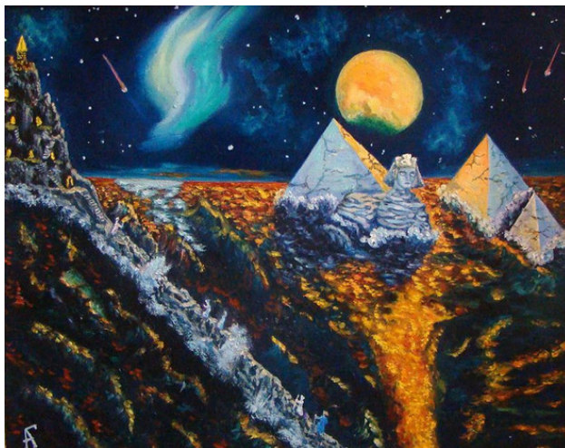
Гибель Атлантиды. Андреева Г. В.