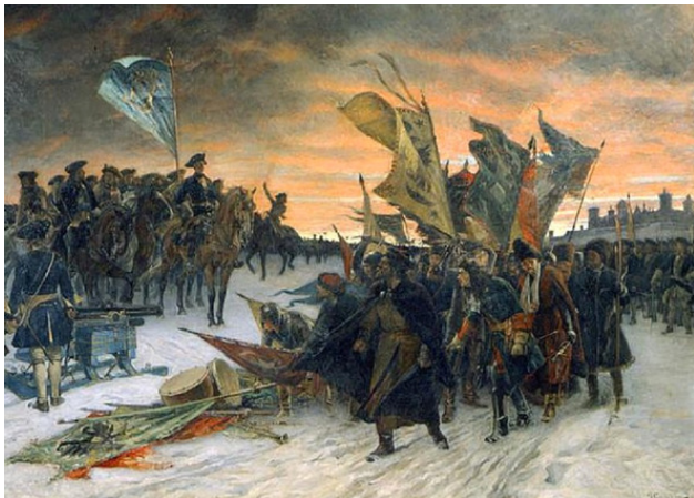
Художник Густав Седерстрём «Триумф под Нарвой»

Кроме того, Пётр I принимал меры по срочному восстановлению и строительству укреплений у Архангельска, Пскова, Новгорода и Москвы. Однако, вопреки ожиданиям, Карл XII принял решение о вторжении в Саксонию и Польшу. На шведском военном совете часть генералов высказалась за наступление на Москву, но Карл XII посчитал, что русская армия слишком слабая, чтобы в ближайшие годы угрожать шведам на севере. Это решение дало Петру возможность восстановить силы после поражения под Нарвой и возобновить наступательные действия на севере.