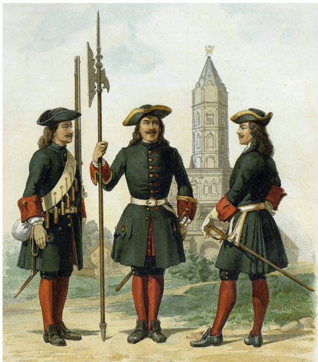
Армия Петра I: рядовой, сержант с алебардой, офицер, Преображенского полка

ная пуговица. При выслушивании приказаний от старших младшие снимали шляпу и держали её слева подмышкой. Офицеры и солдаты носили длинные до плеч волосы, которые в парадных случаях пудрили мукой.