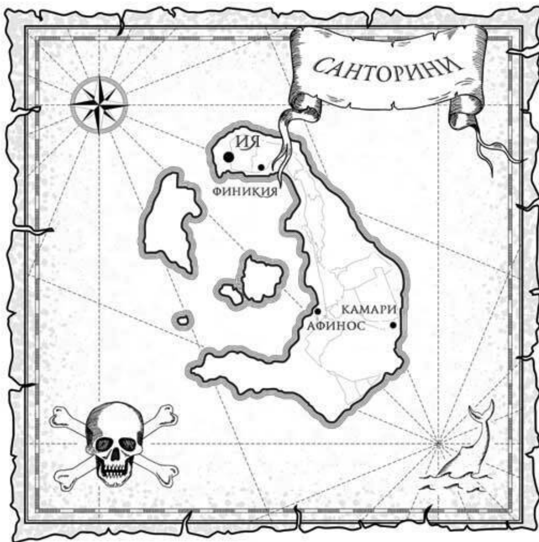
Карта греческого острова Санторини

цунами. Волны, достигающие в высоту почти 20 метров, обрушились на остров Крит и полностью уничтожили древнейшую в Европе высокоразвитую минойскую цивилизацию.