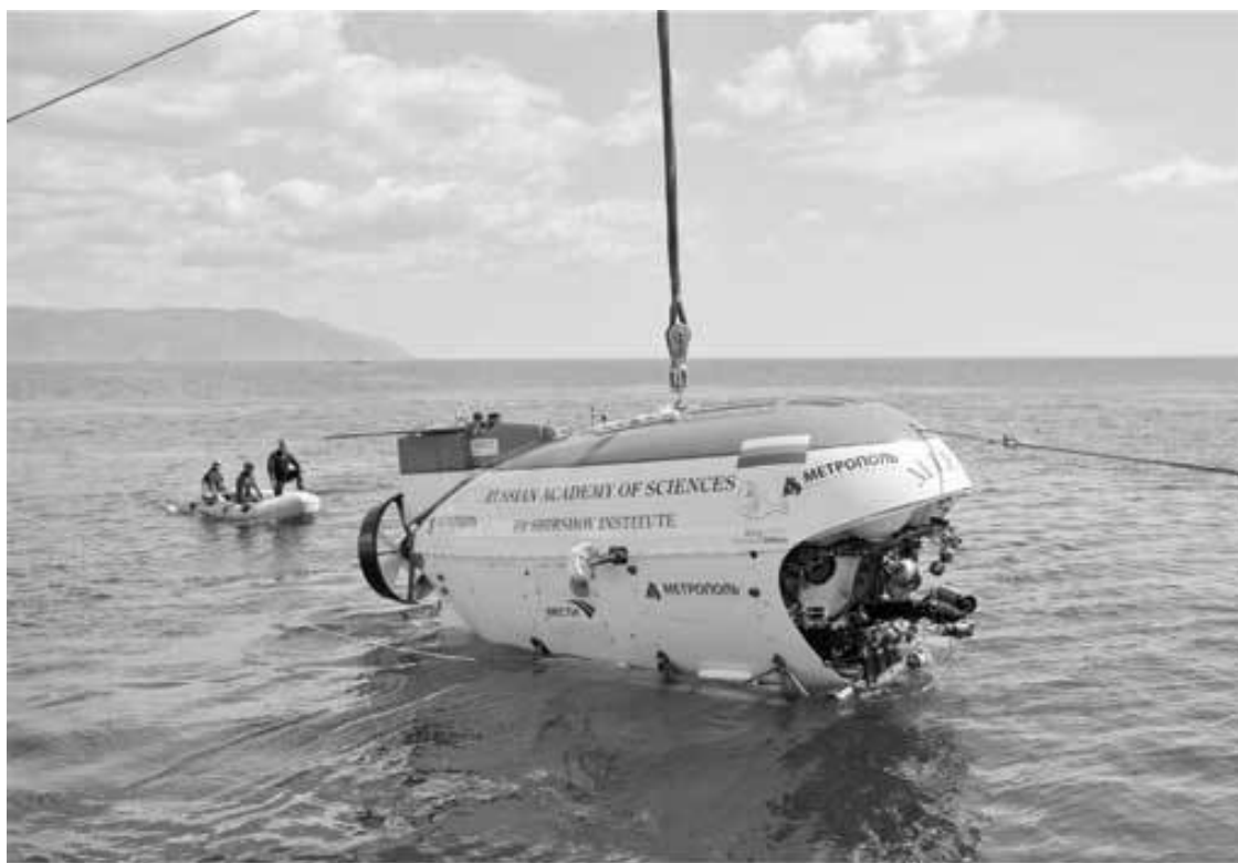
Глубоководный исследовательский аппарат «Мир-1»

24 июля 2008 года с борта российского судна в озеро Байкал выгружают глубоководный исследовательский аппарат «Мир». Это первое погружение подобного аппарата в пресной воде. Ситуация нестандартная, и вся команда в напряжении. «Мир» медленно начинает погружаться в водную бездну: двести метров, четыреста... вокруг только черный омут. Неожиданно на глубине 500 метров аппарат подает сигнал: найден объект. Загорается тревожная красная кнопка, батискаф идет на сближение. Разобрать, что именно находится за бортом, ученым не удастся. Со дна мгновенно начинает подниматься ил, вода мутнеет. С земли поступает команда: «Немедленно всплывать!», и «Мир» идет на поверхность. Что именно зафиксировал глубоководный аппарат и почему было принято решение об экстренном подъеме батискафа, до сих пор не известно. По официальной версии, начался шторм, и продолжать работу в таких условиях было попросту опасно. Однако есть другая, неофициальная версия, согласно которой батискаф встретил на глубинах Байкала то, чего по представлениям современной науки в пресной воде быть не может.