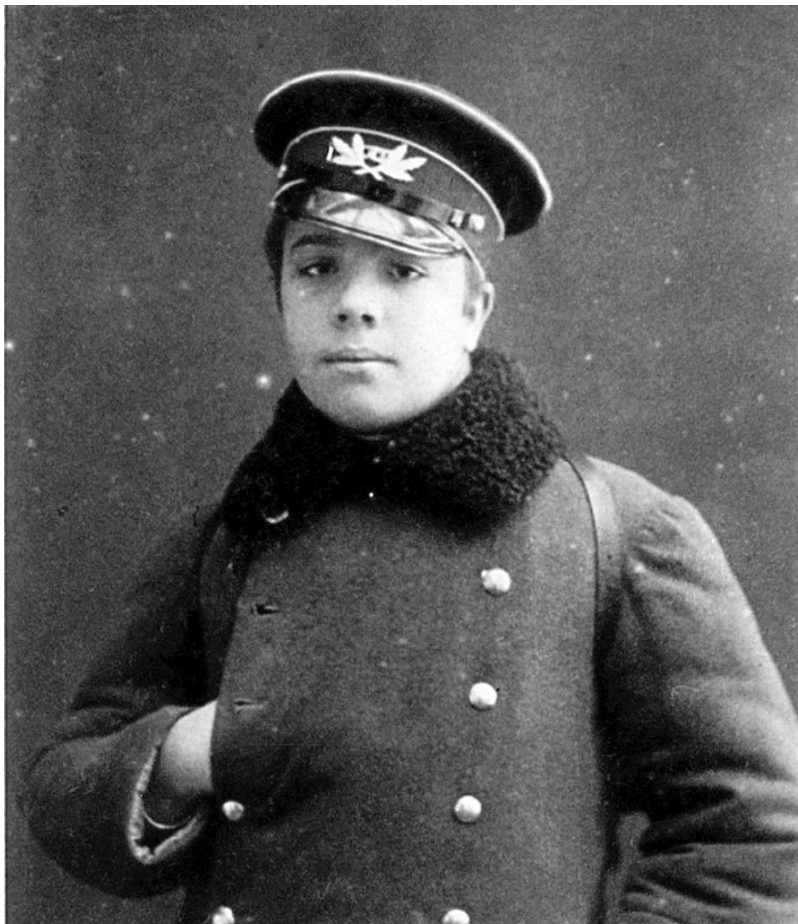
Дягилев в гимназической форме

Сергей с ранних лет учился игре на фортепиано и занимался вокалом, проявляя выдающиеся способности к музыке. Он также пробовал себя в композиции. Его первым серьезным опытом сочинения был романс в подражание Глинке «Ты помнишь ли, Мария?», который пятнадцатилетний мальчик написал по случаю годовщины свадьбы своих родителей. Каллиграфически переписанную партитуру этого романса мать Дягилева сберегла, благодаря чему она сохранилась, единственная из всего написанного Дягилевым-композитором.