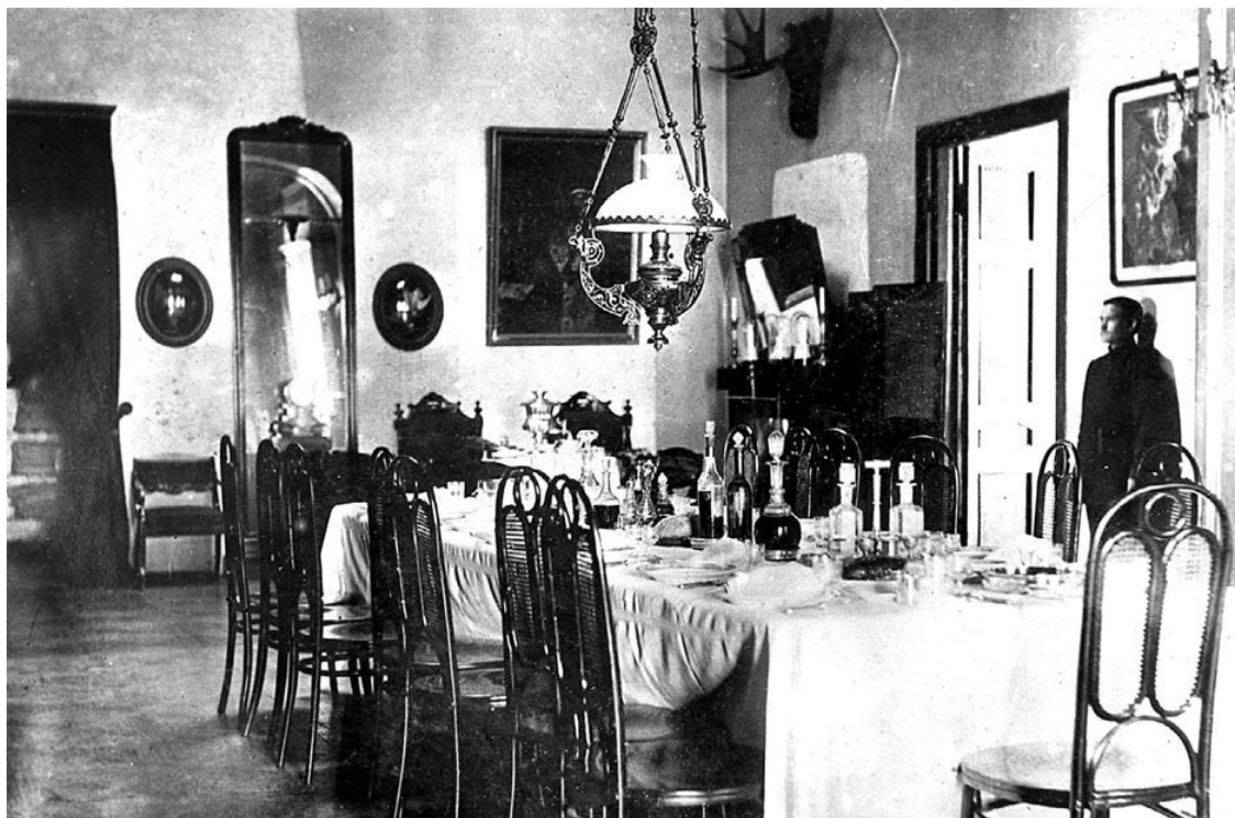
Столовая Дягилевых в Перми

О том, что они не всегда были в радость для семилетнего Сережи, мы можем узнать, ознакомившись с первым из его сохранившихся письменных документов. Это письмо он написал своему отцу в том же 1879 году во время их гораздо более короткой поездки в Курск, где жили родственники его матери: