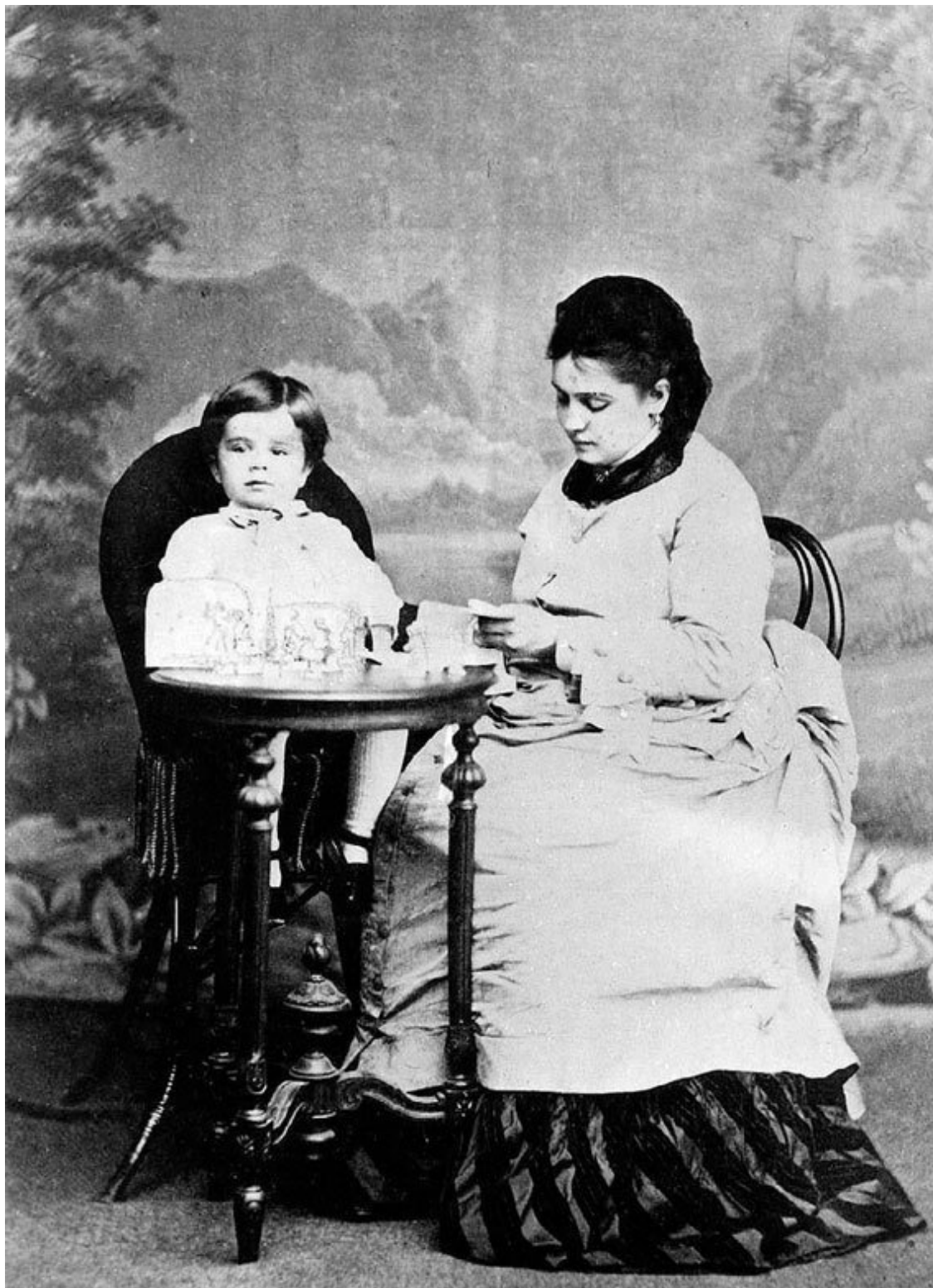
Сергей Дягилев с мачехой

приучила его никогда не пользоваться словами: я не могу. “Эту фразу ты должен забыть, – говорила она ему, – когда хотят – всегда могут” 13 ».