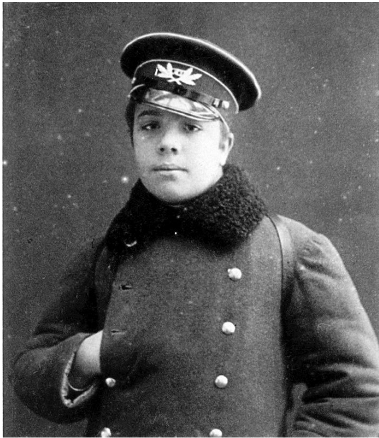
Дягилев в гимназической форме

Сергей с ранних лет учился игре на фортепиано и занимался вокалом, проявляя выдающиеся способности к музы-