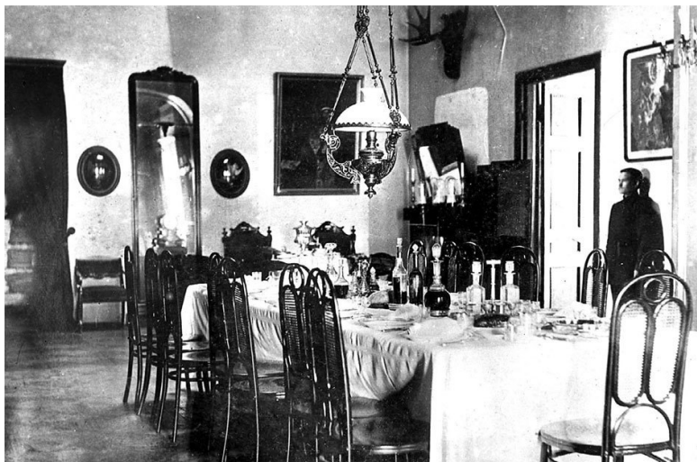
Столовая Дягилевых в Перми

О том, что они не всегда были в радость для семилетнего Сережи, мы можем узнать, ознакомившись с первым из его сохранившихся письменных документов. Это письмо он написал своему отцу в том же 1879 году во время их гораздо более короткой поездки в Курск, где жили родственники его матери: