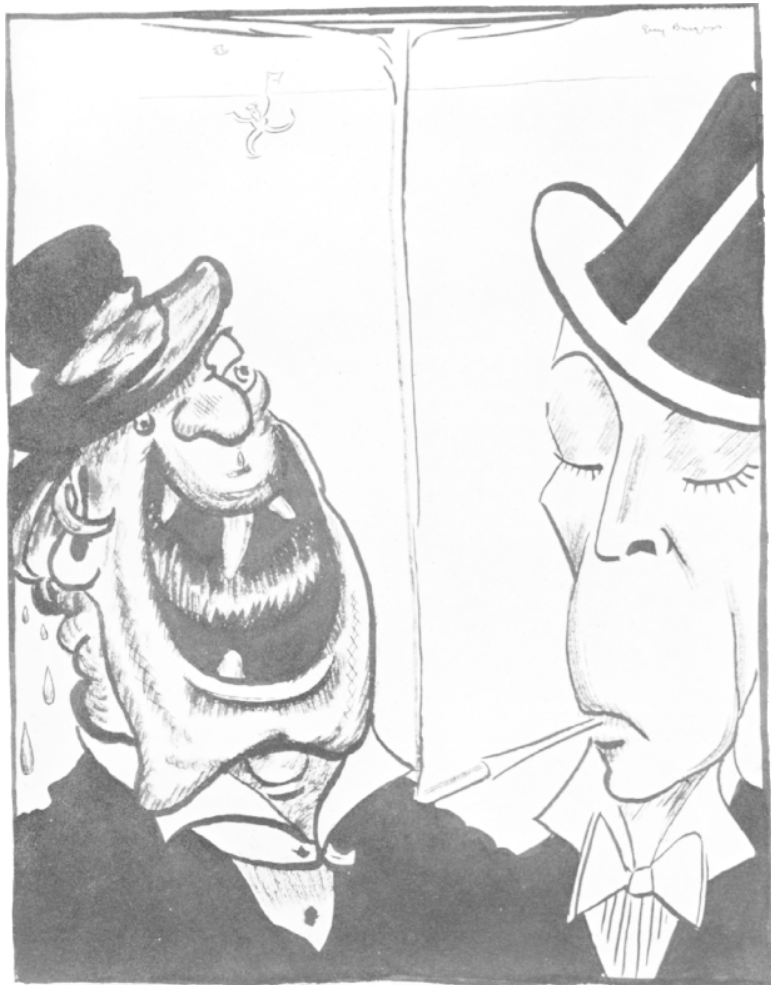
Шарж Гая Бёрджесса в итонском журнале «Мотли», 10