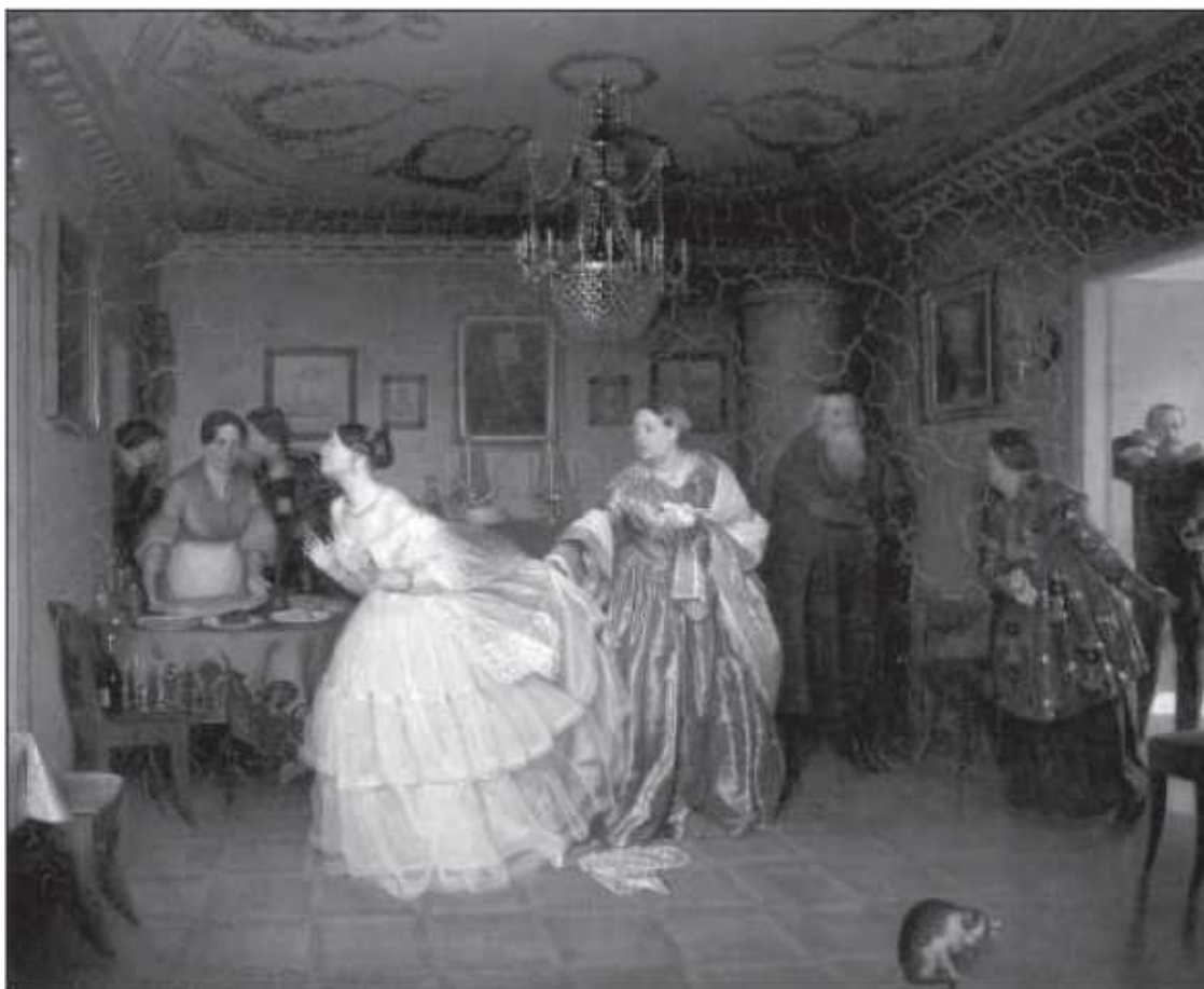
П. А. Федотов. Сватовство майора

«В перепуге, – говорит, – я была, Домна Платоновна, простите, пожалуйста».