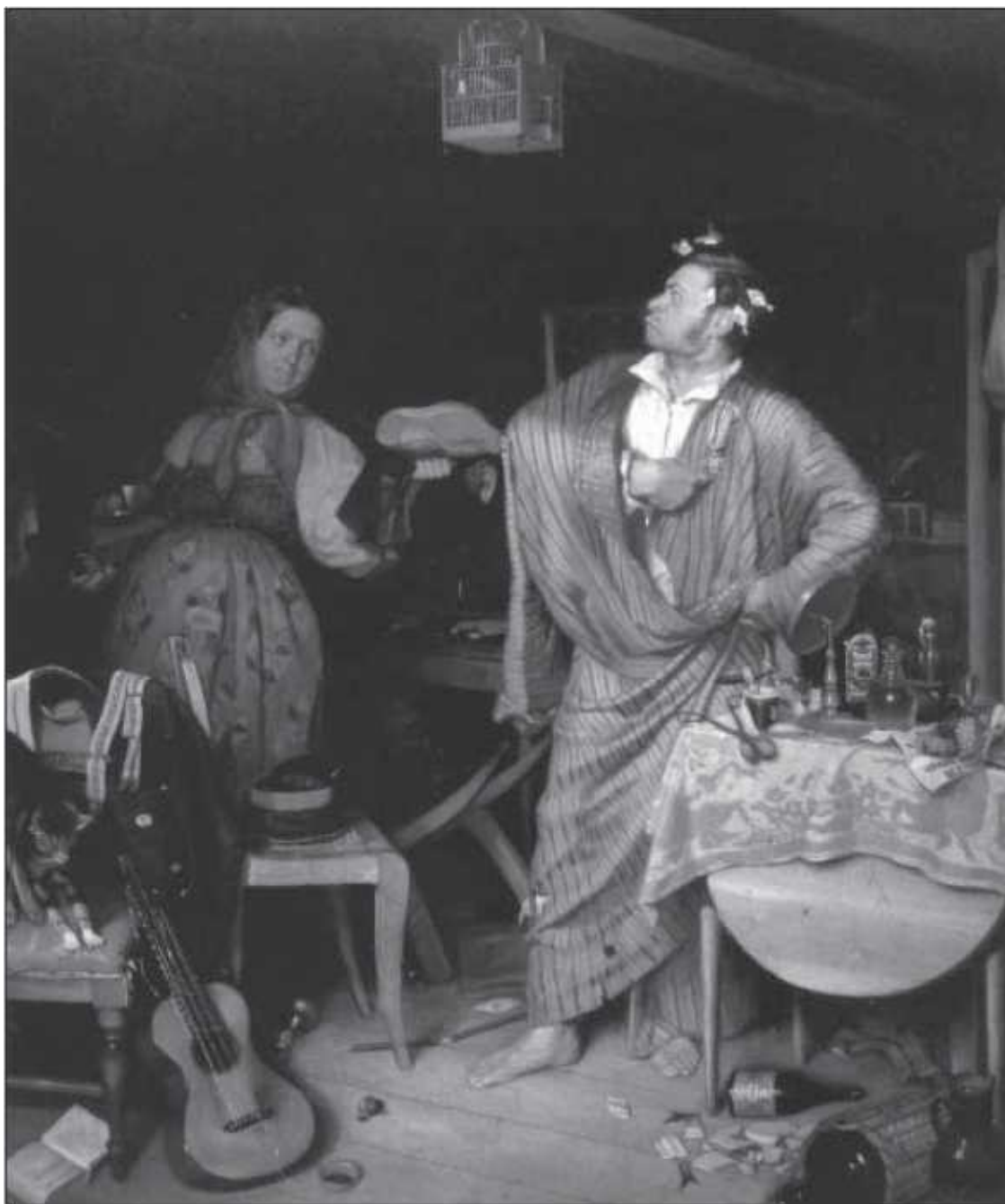
П. А. Федотов. Свежий кавалер

«Уж разумеется, – говорит, – когда вол, так не годится. А вот я ему, глухому, за это вот какую шутку отшучу: у меня на этого его брата, Степана Матвеича, расписка во сто рублей есть, а у них денег нет; ну, так я им себя теперь и покажу».