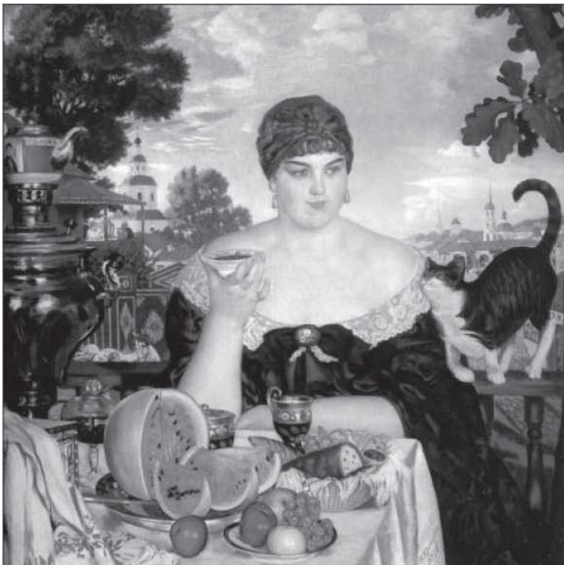
Б. М. Кустодиев. Купчиха за чаем

– Да как про это расскажешь? Разве можно про это изъяснить, как сохнешь? Тосковал.