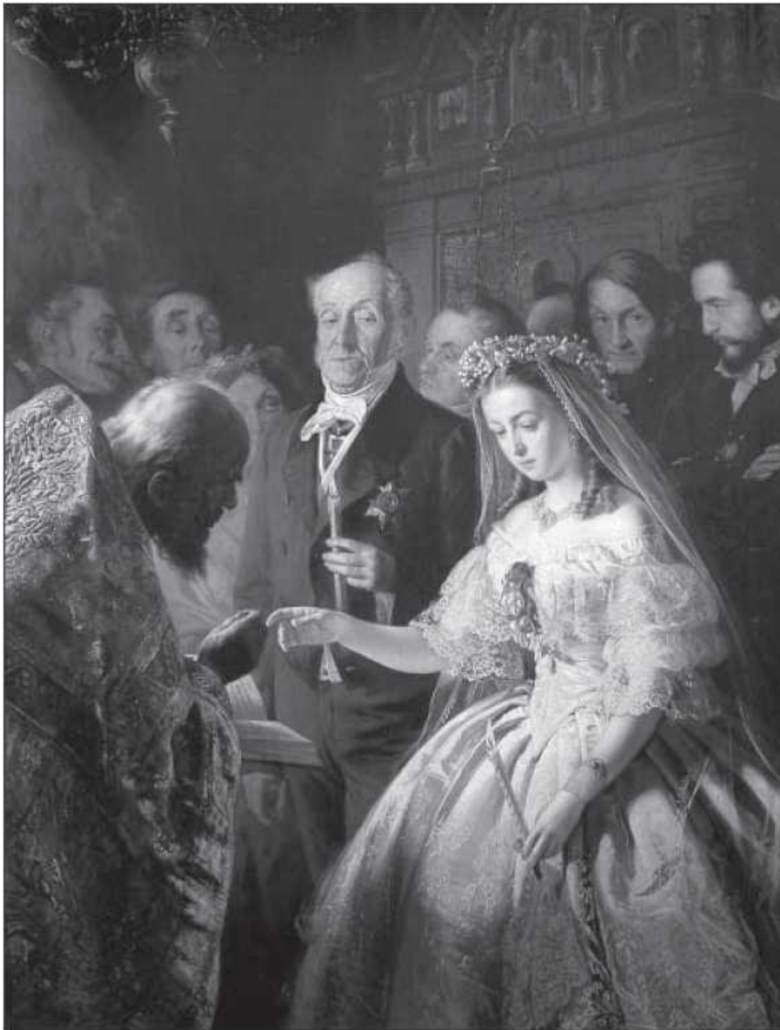
В. В. Пукирев. Неравный брак

Пошла, и слышу, как была опять совсем в платье одетая, так и повалилась.