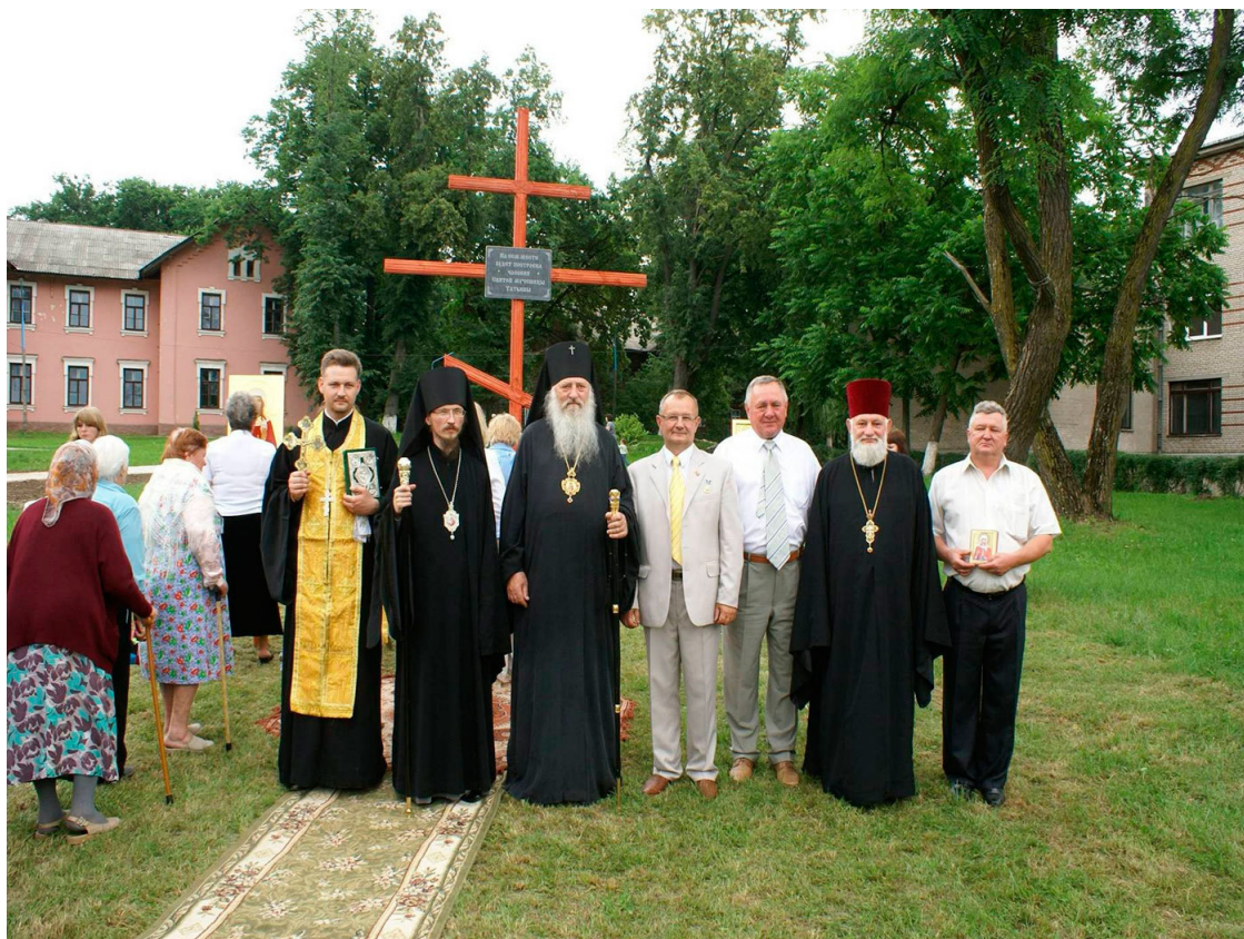
Установка креста на месте будущей часовни. Крайний справа – заместитель директора по воспитательной работе МГАТК.

Спрашивается, почему в нынешнее время, когда землетрясения, извержения вулканов, наводнения, цунами, и другие катастрофы и бедствия, приводившие человека в трепет и объявлявшиеся карой божьей, не только объяснены наукой, но и предсказываются, и при нынешнем развитии космонавтики, компьютерной техники, медицины, и других отраслей науки и техники, немалые средства затрачиваются на строительство и функционирование церквей, ежедневно по радио звучат религиозные передачи, попы стали почётными участниками телепередач, церковные обряды заменяют светские? Почему Совет Министров РБ Постановлением № 838 от 26.06. 2011 г. издал Положение, допускающее взаимодействие учреждений образования с религиозными организациями в воспитании обучающихся?